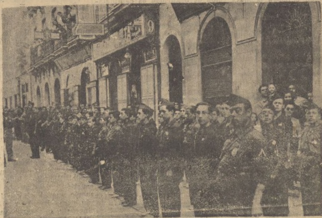
Los «balillas»—legión de chiquillos—que llevan en su alma todo el fervor que supieron imprimirle sus primogénitos, esperan al general Millán Astray como queriéndole decir: Aquí está la juventud para otorgar sus vidas, si es necesario, en aras de España.

Fuó realmente un momento de intensa emoción. De la banda de música apenas se escuchaban sus acordes, pues las