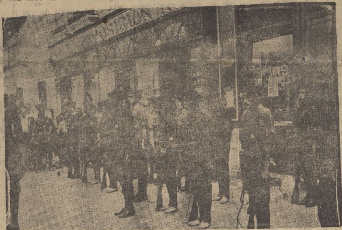
Los «requetés», pocos en número, pero muchos—y esto quiere decir cantidad—en valentía y temeridad cuando al peligro se acercan, esperan al general Millán Astray para testimoniar su adhesión al movimiento salvador de España.

merecida al heroico general que tantas veces ofreció su vida—sin que el holocausto quedara consumado—en aras de esta bendita patria, santa, única e inmortal.