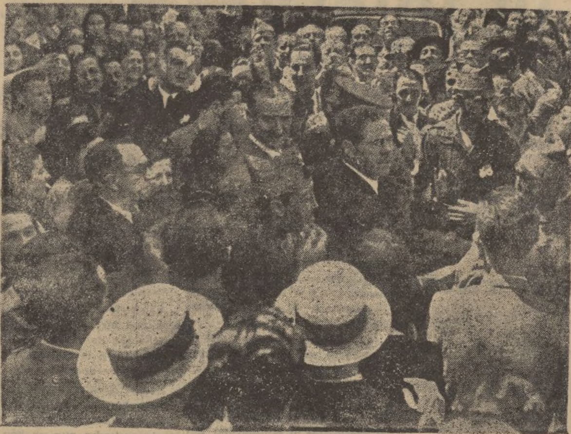
SEVILLA —El general Queipo de Llano con el gobernador civil don Pedro Parías, al salir de la Misa por el general Sanjurjo, aclamado por la multitud