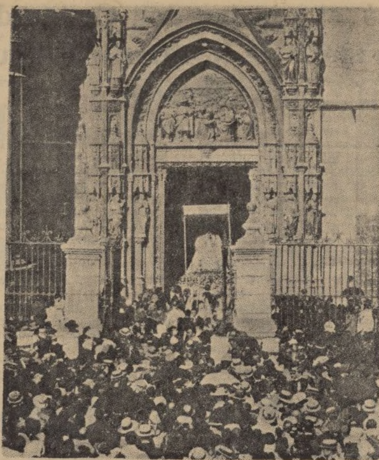
Imagen de la Virgen de los Reyes, que se venera en Sevilla

Existe la arraigada creencia de que pidiéndole a la Virgen tres cosas en el momento de salir en procesión por la puerta ventada, concede una de ellas, y como son tantas las necesida-