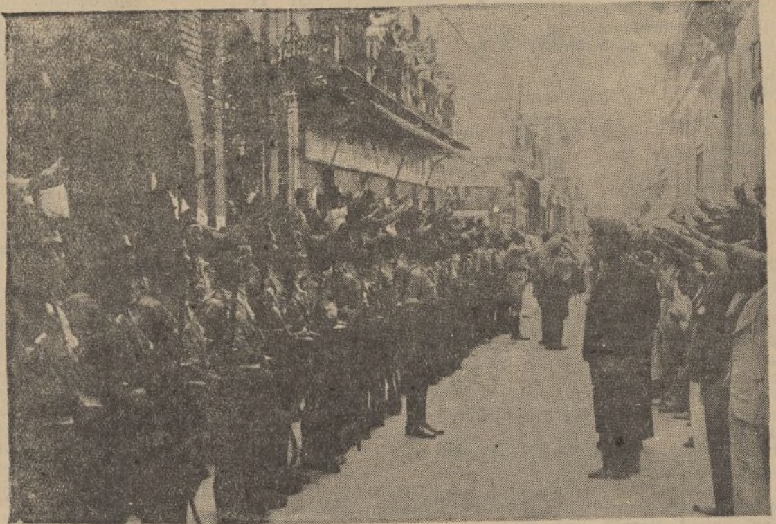
Las fuerzas del Ejército rinden honores al general Millán Astray a su llegada al Gobierno civil

Novela de costumbres, original de D. Julián Castellano y Velasco. Autorizada por la Casa Editorial Castro S. A. de Carabanchel. NÚM. 116