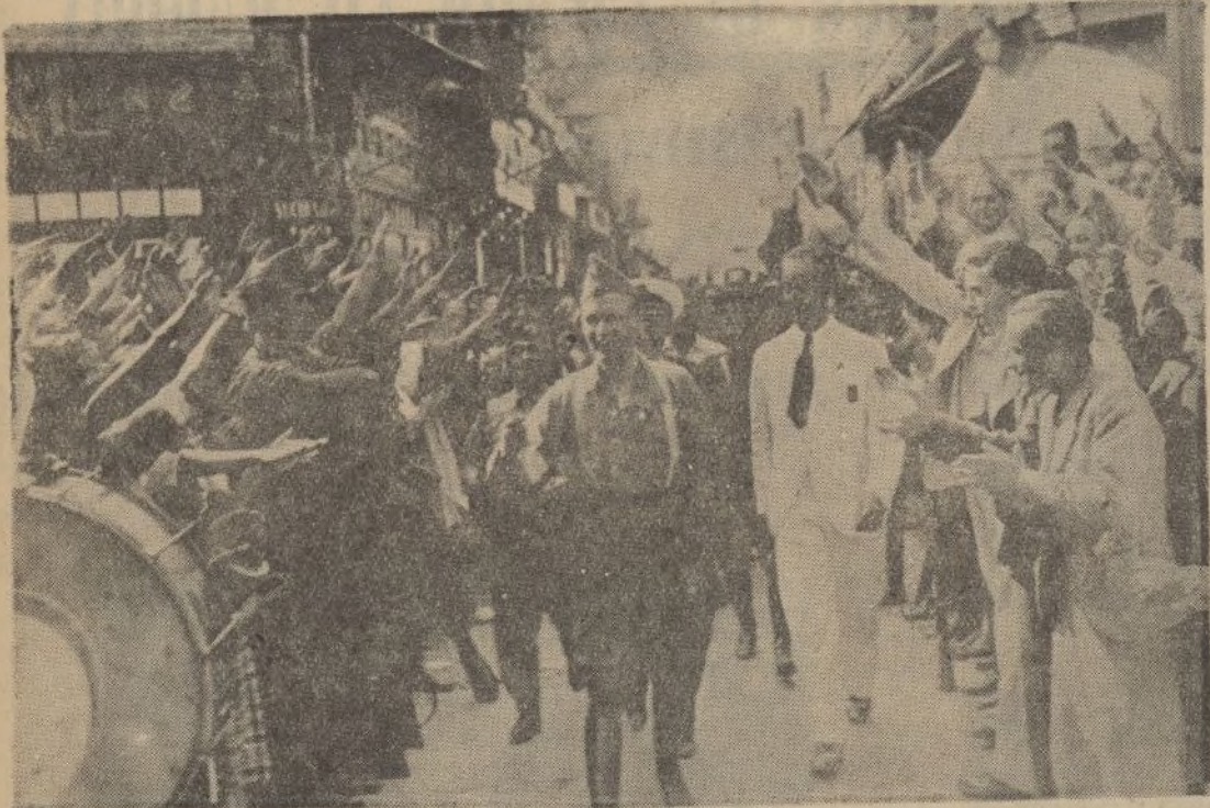
El glorioso creador del Tercio desfila por las calles de Huelva entre grandes y clamorosas ovaciones