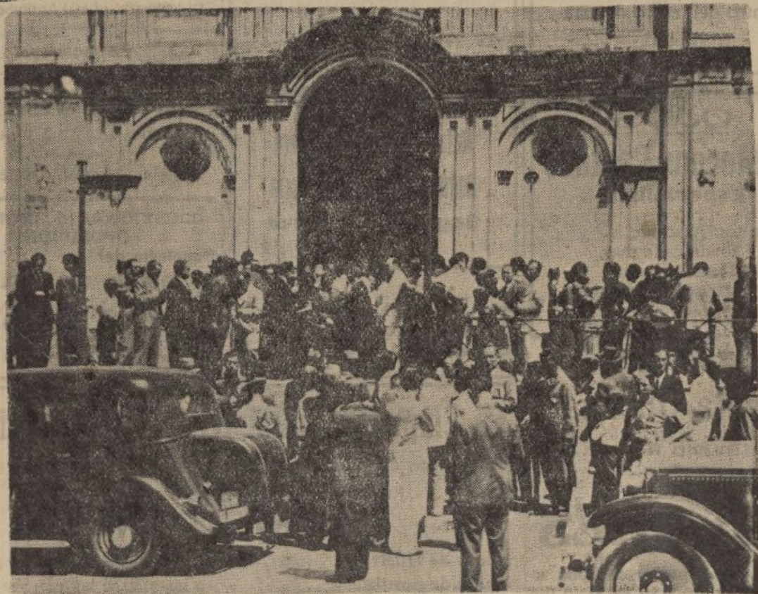
El público, numerosísimo público por supuesto, sale de la Iglesia de la Merced, después de los funerales por el Sr. Calvo Sotelo. En la «foto» se observa al gobernador Sr. De Haro cuando es despedido por el Arcipreste.