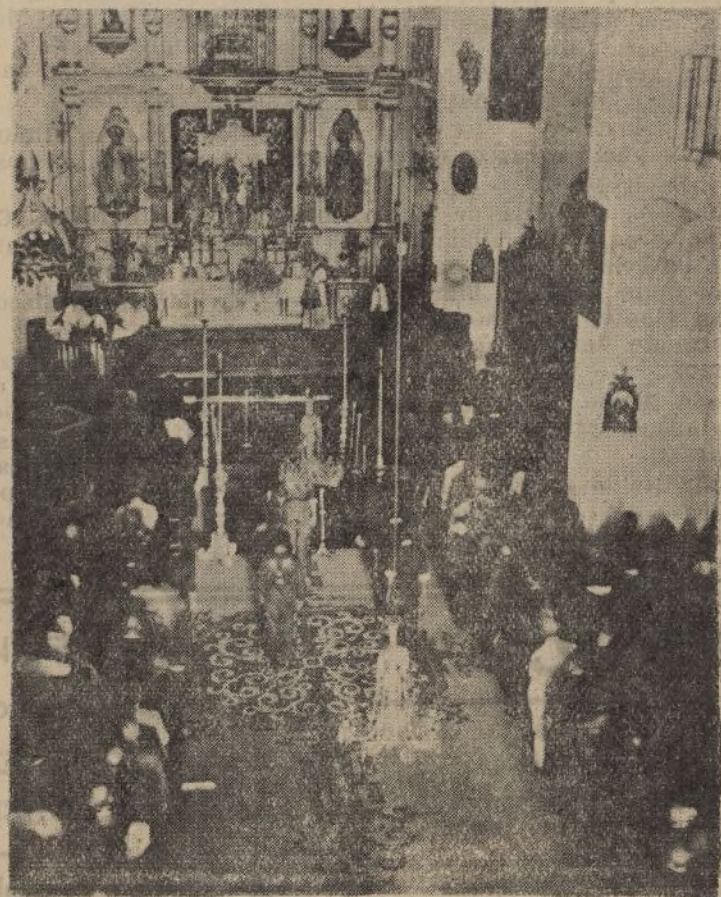
En la Iglesia de la Merced, y ante gran concurrencia de fieles, con las autoridades a la cabeza, se celebraron ayer solemnes exequias por el alma del que fué insigne patriota, don José Calvo Sotelo.