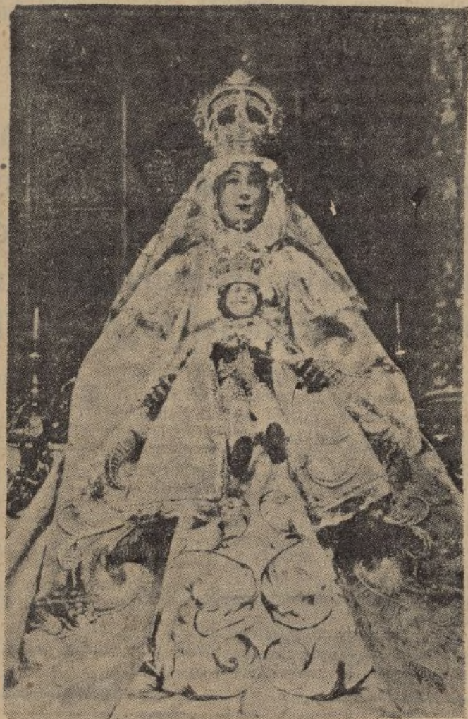
La Virgen de los Reyes saliendo por la puerta de los Palos de la Catedral de Sevilla.

más amada y admirada del pueblo; ni la propia Esperanza de la Macarena, por quien delira, ni la Victoria de las cigarreras, a la que se venera con la mayor exaltación del alma y de los sentidos. Así es que el 15 de Agosto en Sevilla es uno de los días más sonados, porque se dedica a la Virgen predilecta de su corazón, y las fiestas son de lo más típico y pintoresco.