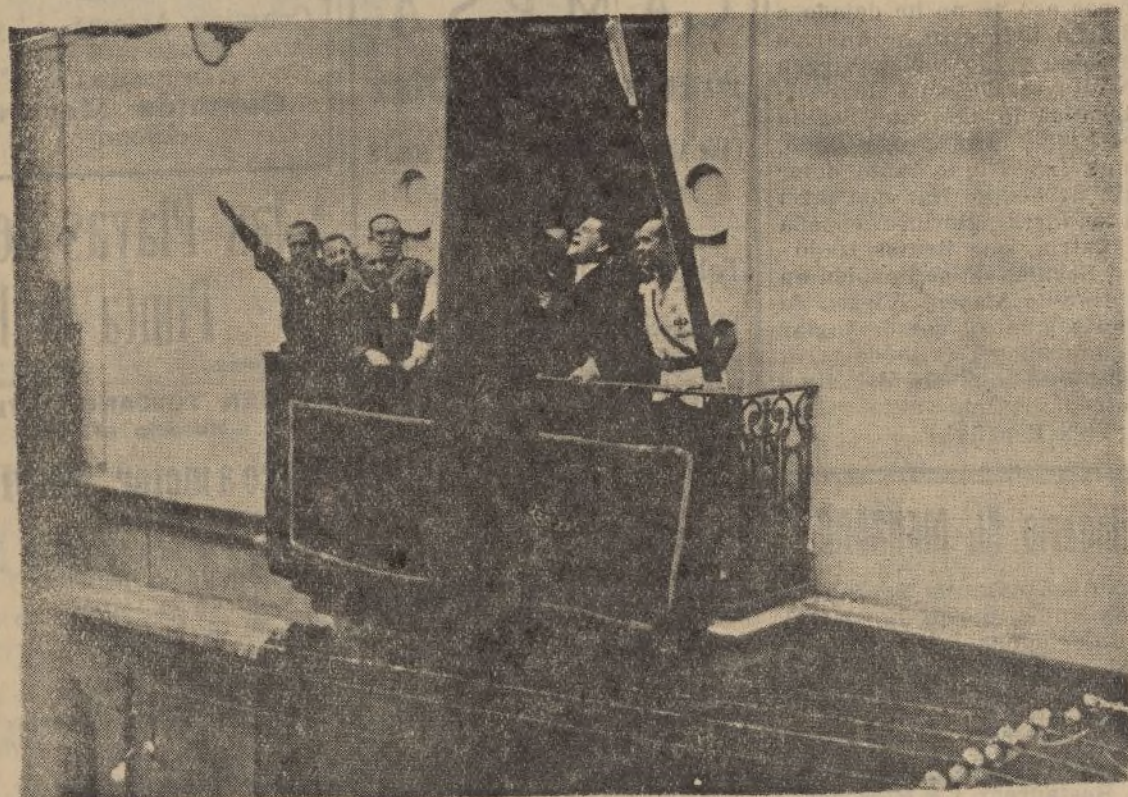
¡Viva España! fué el grito espontáneo que ayer se escapó del corazón de todos los onubenses cuando la bandera roja y gualda fué izada en el Gobierno civil

La manifestación obrera de simpatía al gobernador saldrá hoy a las 12 y media desde el Ayuntamiento