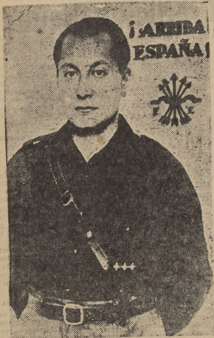
Don José Antonio Primo de Rivera, jefe nacional de Falange Española y partícipe singular del futuro engrandecimiento de nuestra Patria