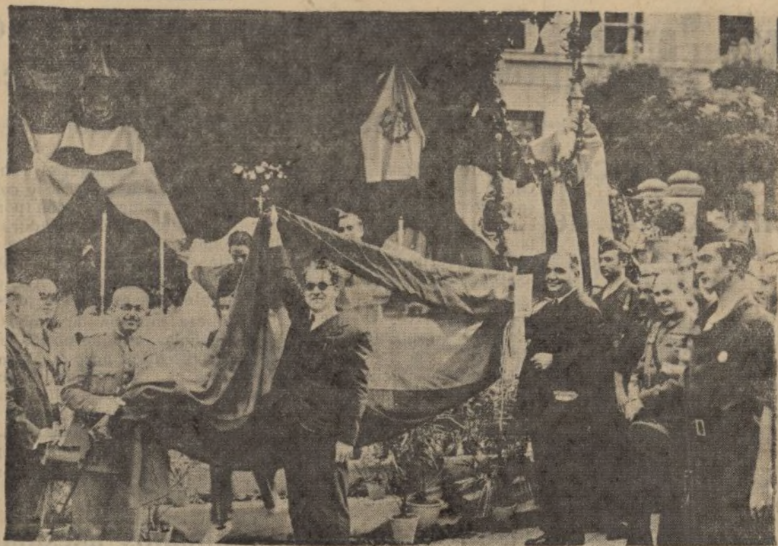
Las autoridades de Huelva muestran la bandera—nuestra bandera—con la satisfacción propia de los buenos españoles. El grito de ¡viva España! es unánime y victorioso