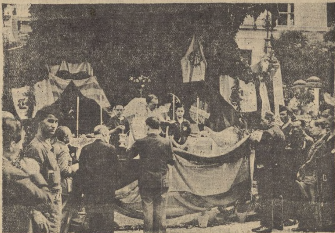
El arcipreste de Huelva bendice la bandera española que después fué izada en el balcón central del Gobierno civil