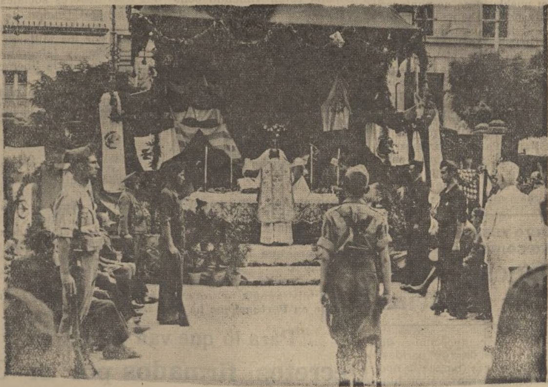
Religión y Patria. España sigue su trayectoria gloriosa. Es su destino