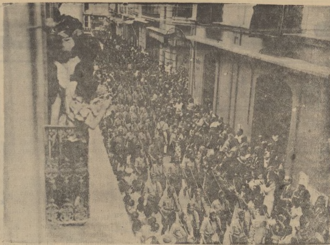
La fuerzas desfilaron ayer por las calles de Huelva, después de celebrada la misa de campaña, en medio de clamorosas y continuas ovaciones