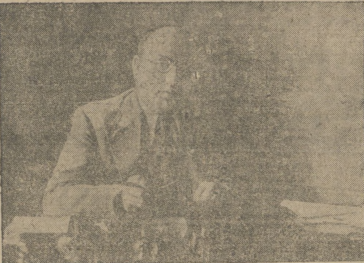
El compañero Rafael Henche, alcalde de Madrid, al que hacemos portador de nuestra admiración hacia su heroico pueblo en este segundo aniversario de su invencible resistencia.

Disponiendo se celebre una conferencia para el estudio, discusión y adopción de las bases por que han de regularse los servicios del personal de Banca.