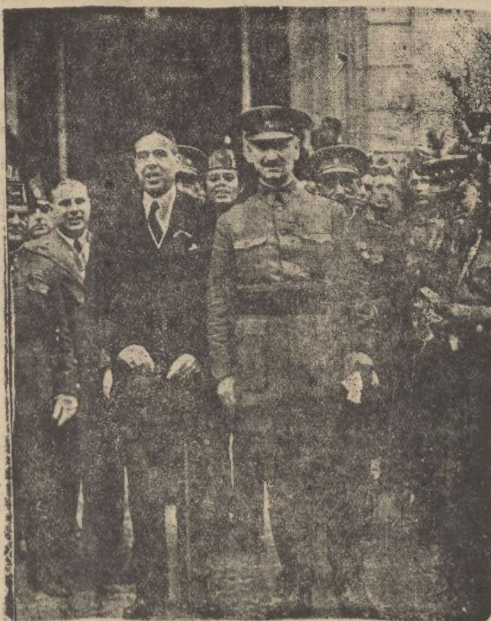
El General Queipo de Llano y el Gobernador civil don Pedro Parias, presenciando el desfile de la procesión de la Virgen de los Reyes en el Ayuntamiento de Sevilla

La columna ha quedado en Aznalcóllar para cumplir con sus distintos cometidos y dejar al pueblo en condiciones de seguridad.