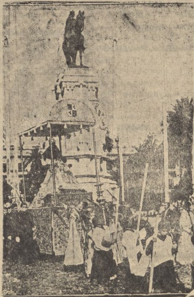
SEVILLA.—La Santísima Virgen de los Reyes en su «paso» ante el monumento de San Fernando