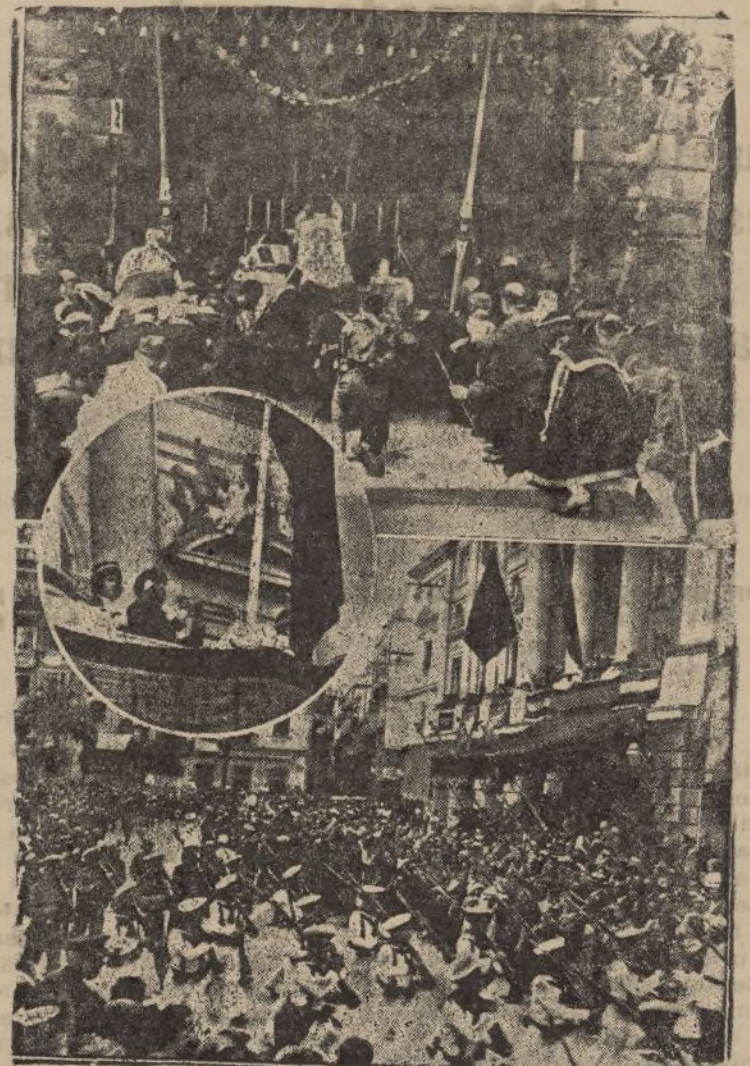
CADIZ.—De la fiesta celebrada el día 16.—Arriba: El momento de Alzar en la misa campaña. En el círculo, el alca- ñor Carranza, izando la bandera nacional en el balcón pr- cipal del Ayuntamiento.—Abajo, las fuerzas de marinería y Ejército, desfilando ante las autoridades, al finalizar el ad

X X X X X X X X X X X X X X X X X LEA VD. X X TODAS LAS MAÑANAS X X DIARIO DE HUELVA X