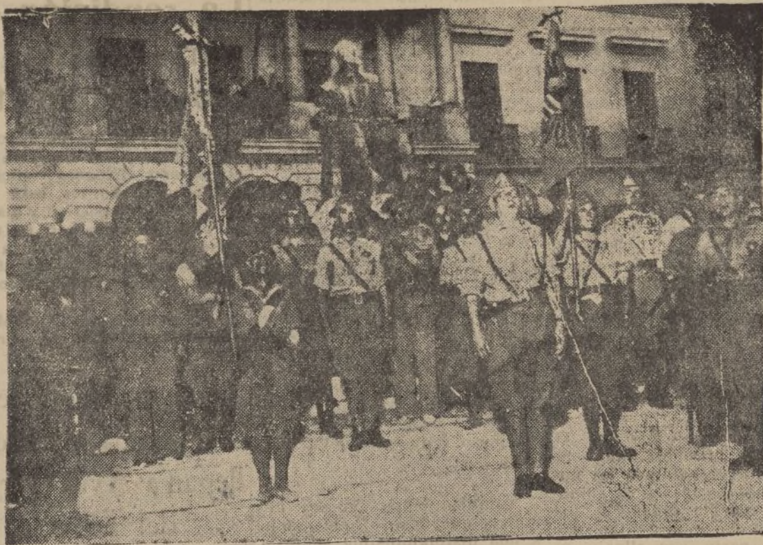
Después de tomada Badajoz por las fuerzas del Tercio, estas cantan su himno con gran entusiasmo patriótico.

Confirmando el interés de toda persona que se ha interesado por ello.