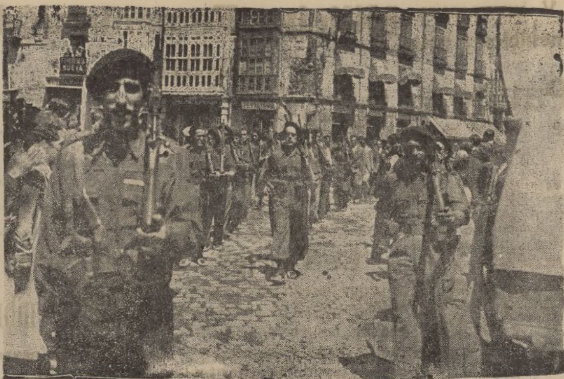
BURGOS.--Desfile de Requetés navarros a su llegada a Burgos.--(Foto, Barrera).