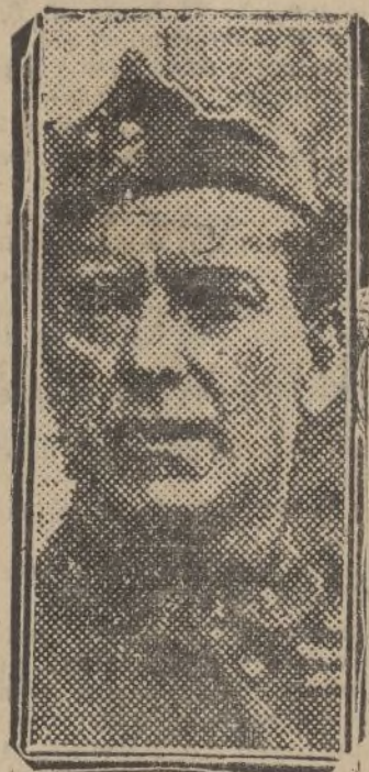
El general López Ochoa, que, al parecer, ha sido vilmente asesinado, en Carabanchel