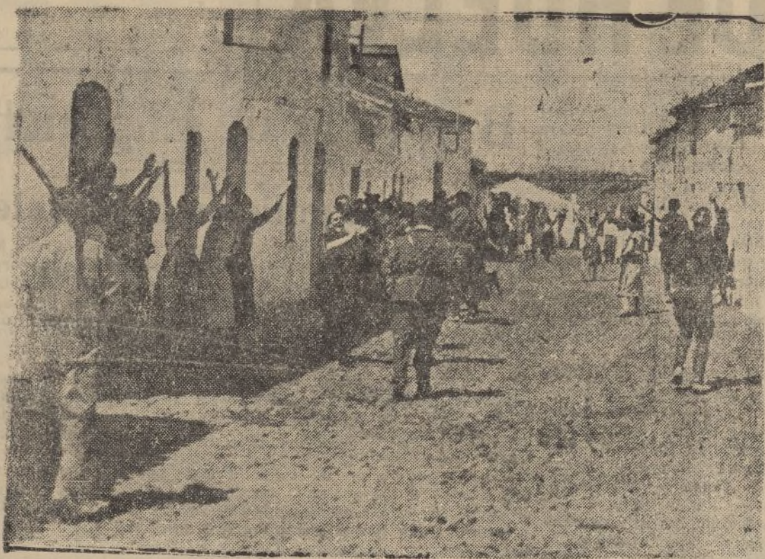
En Castilblanco, después de horas trágicas del dominio marxista, las mujeres reciben a las tropas con delirantes manifestaciones de entusiasmo.