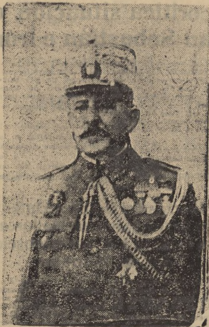
El general Cavalcanti, que manda una columna de Galicia en el frente del Guadarrama.