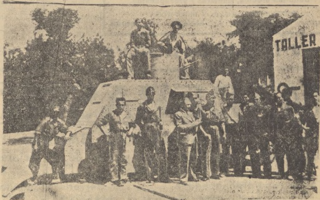
Un carro de asalto, tomado por el Ejército en Badajoz a los revoltosos