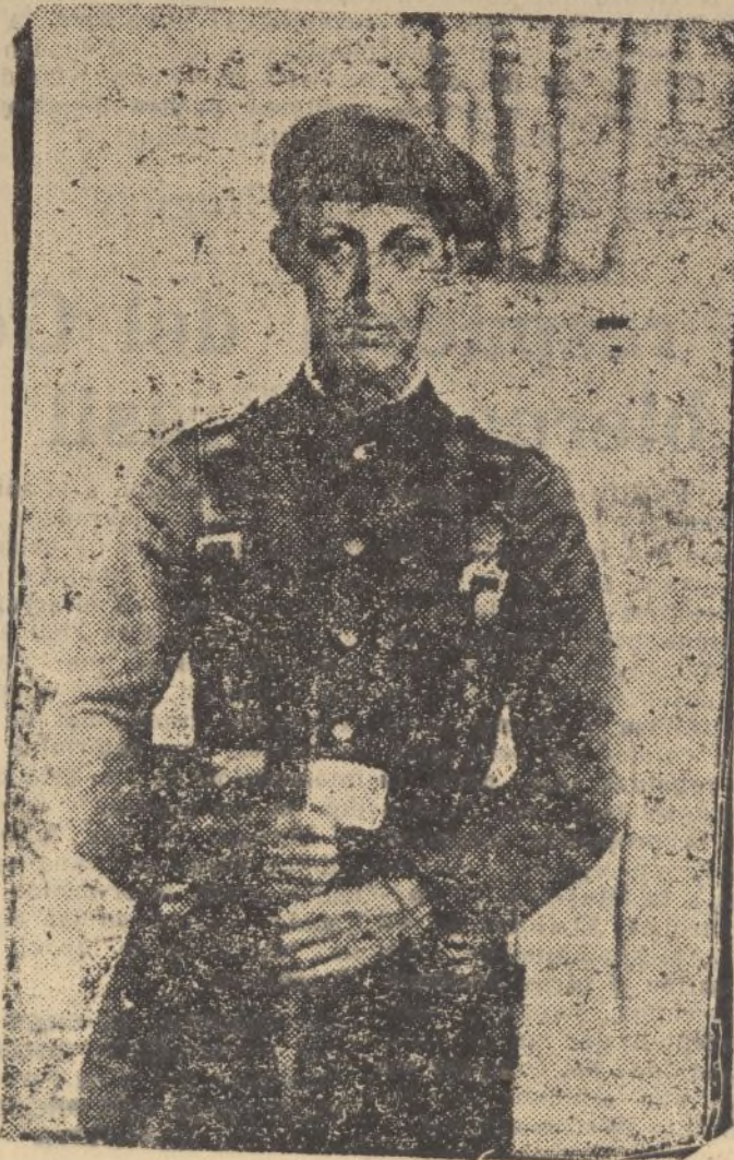
El príncipe don Carlos de Borbón, que lucha con los patriotas en la columna de Mola, agregado a los voluntarios navarros.

Los donativos se siguen recibiendo en el Cuartel del Requeté, en calle Rascón, número 7, teléfono 1334