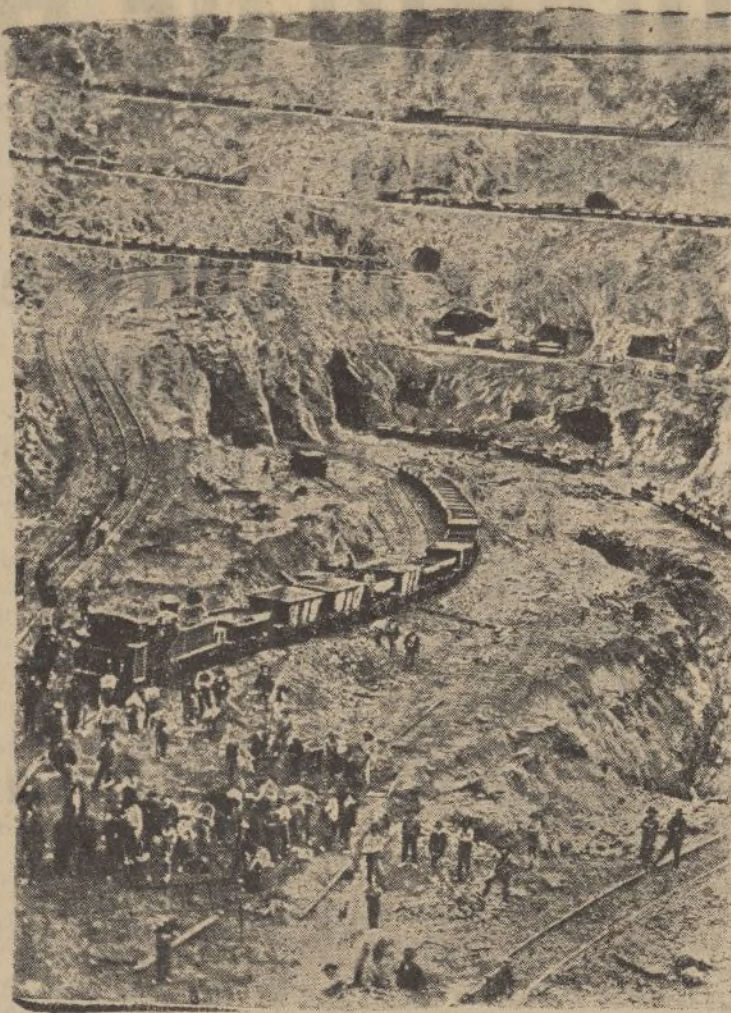
La corta de las Minas de Riotinto, donde sus equivocados obreros sueñan con una «victoria» parecida a la de sus compañeros de Pertunál y La Zarza.

Esto aparte de los ingresos que se quieran hacer en los Bancos para la suscripción pro Ejército.