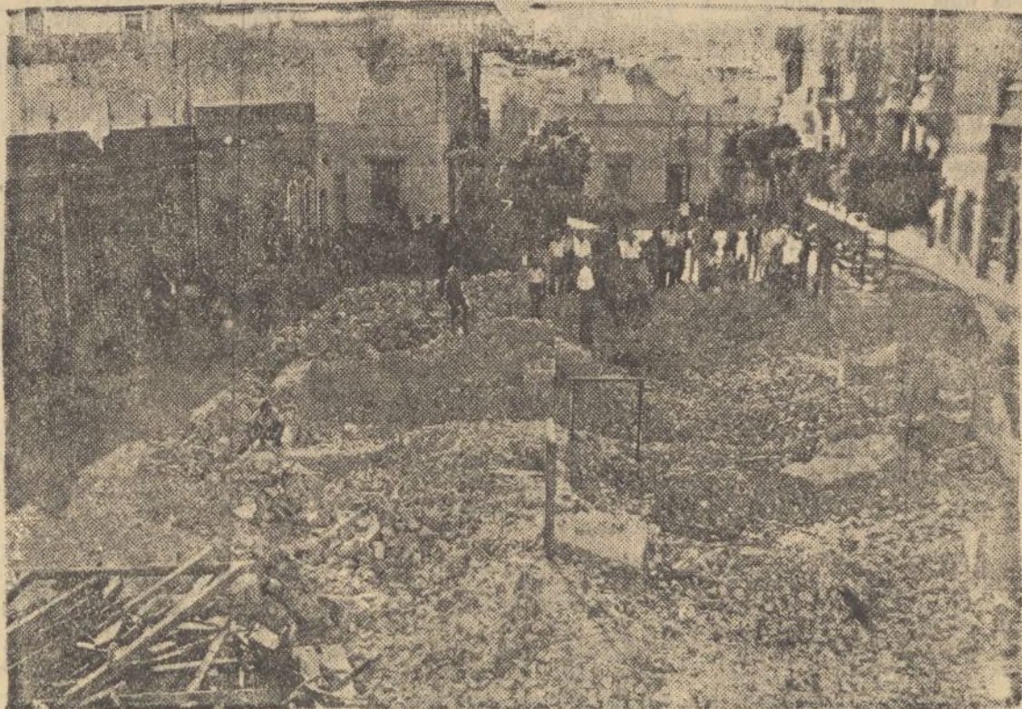
Estado en que quedó la Plaza de la Constitución de Isla Cristina, después de haber sido demolida la Iglesia Parroquial de Nuestra Señora de los Dolores, saqueada y desvastada por los marxistas. (X)