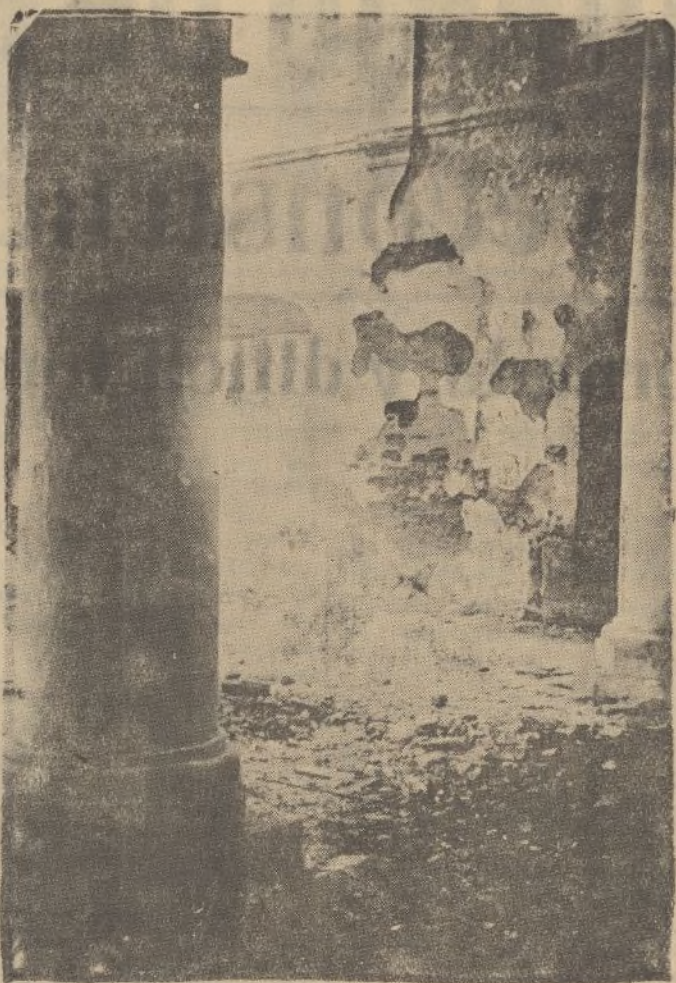
También los marxistas de Zalamea arremetieron contra la iglesia parroquial. En la «foto» se aprecian, aunque parcialmente, los destrozos causados en el interior del templo.

Sentíamos las necesidades del aseo y del sueño, y nos propusimos satisfacerlas por unas horas en nuestra casa.