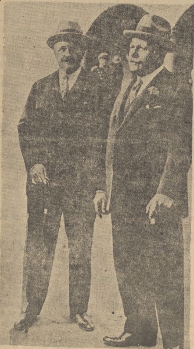
Don Serafín y Joaquín Álvarez Quintero, los insignes comediantes sevillanos, fusilados también por las milicias marxistas.