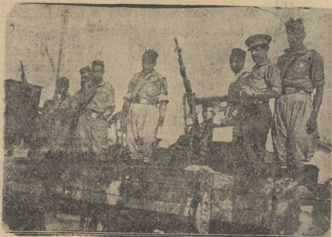
Un camión con fuerzas de Regulares, que se dirigen al frente del Guadarrama.