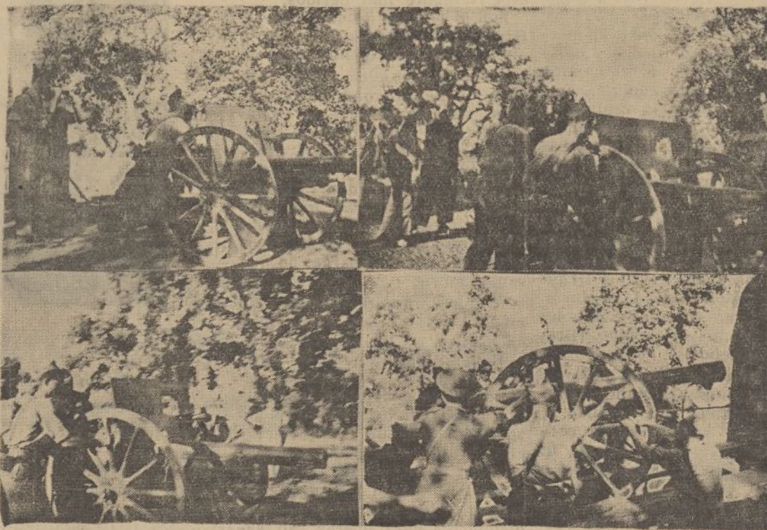
Los cañones son emplazados en las inmediaciones de Zalamea, sobre cuyo pueblo dispararon repetidas veces favoreciendo muy pronunciadamente el avance de las tropas

El recorrido de Valverde a Zalamea se hace con grandes precauciones, pues se decía que había petardos colocados oculta-mente, con el propósito de hacerlos estallar a nuestro paso.