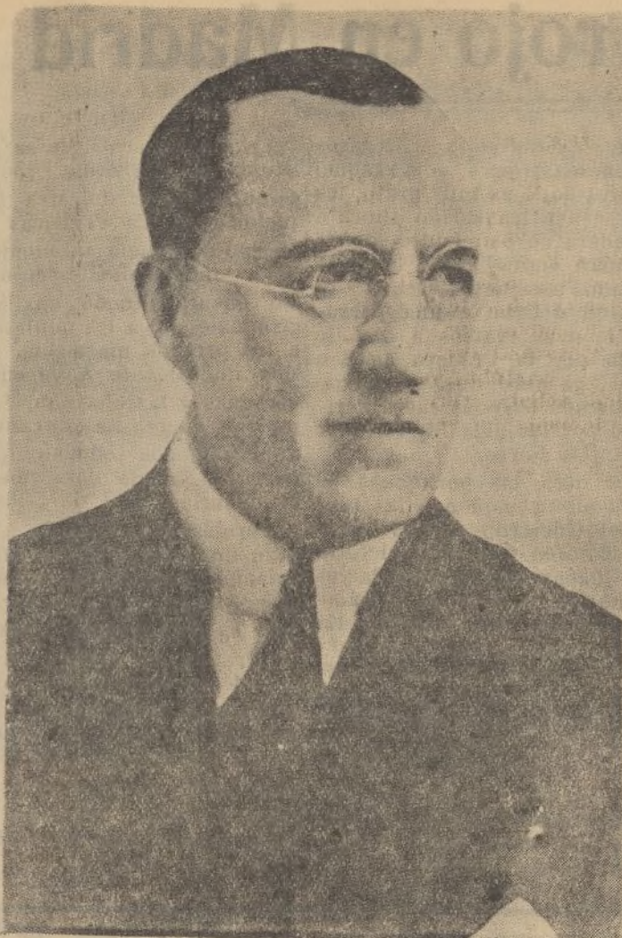
El ilustre escritor Ramiro de Maeztu, que los marxistas fusilaron en Madrid.