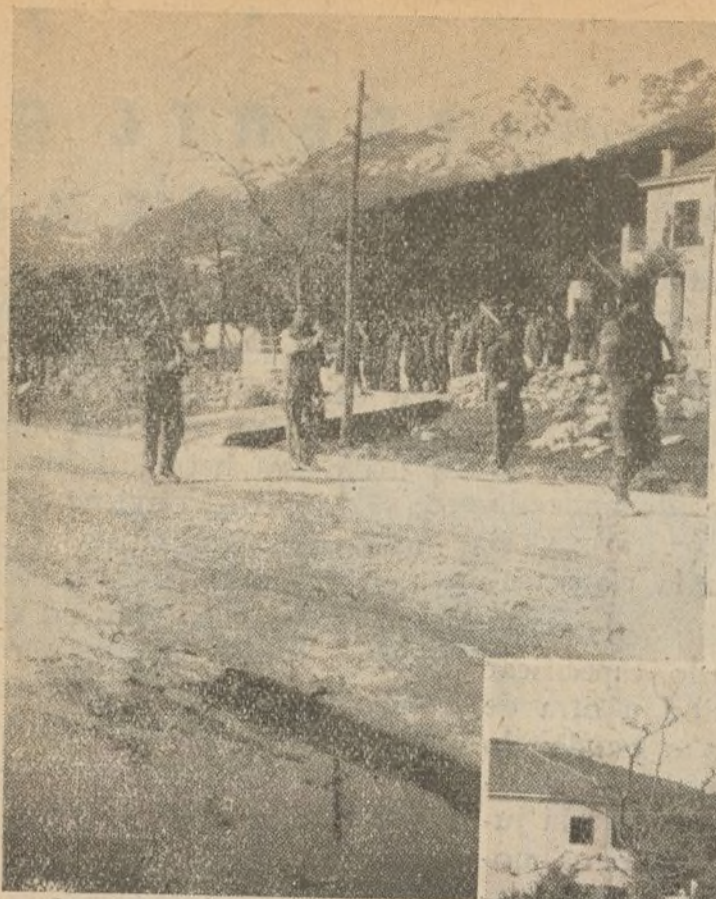
Nuestro 4.º Batallón, desfilando ante los Altos Mandos