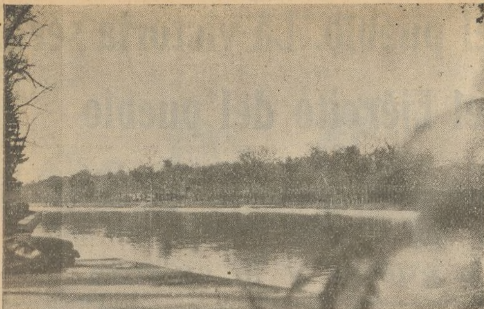
El lago de la Casa de Campo hace tiempo que ya está limpio de facciosos. Sus aguas no reflejarán más la imagen de la traición.

Se avanza por el frente de Guadalajara.— Nuevos pueblos caen en nuestras manos.— En la foto un milita- no sobre las ruinas de Algara, sim- bolizando la liberación y el triunfo : de la democracia. ¡Adelante! :