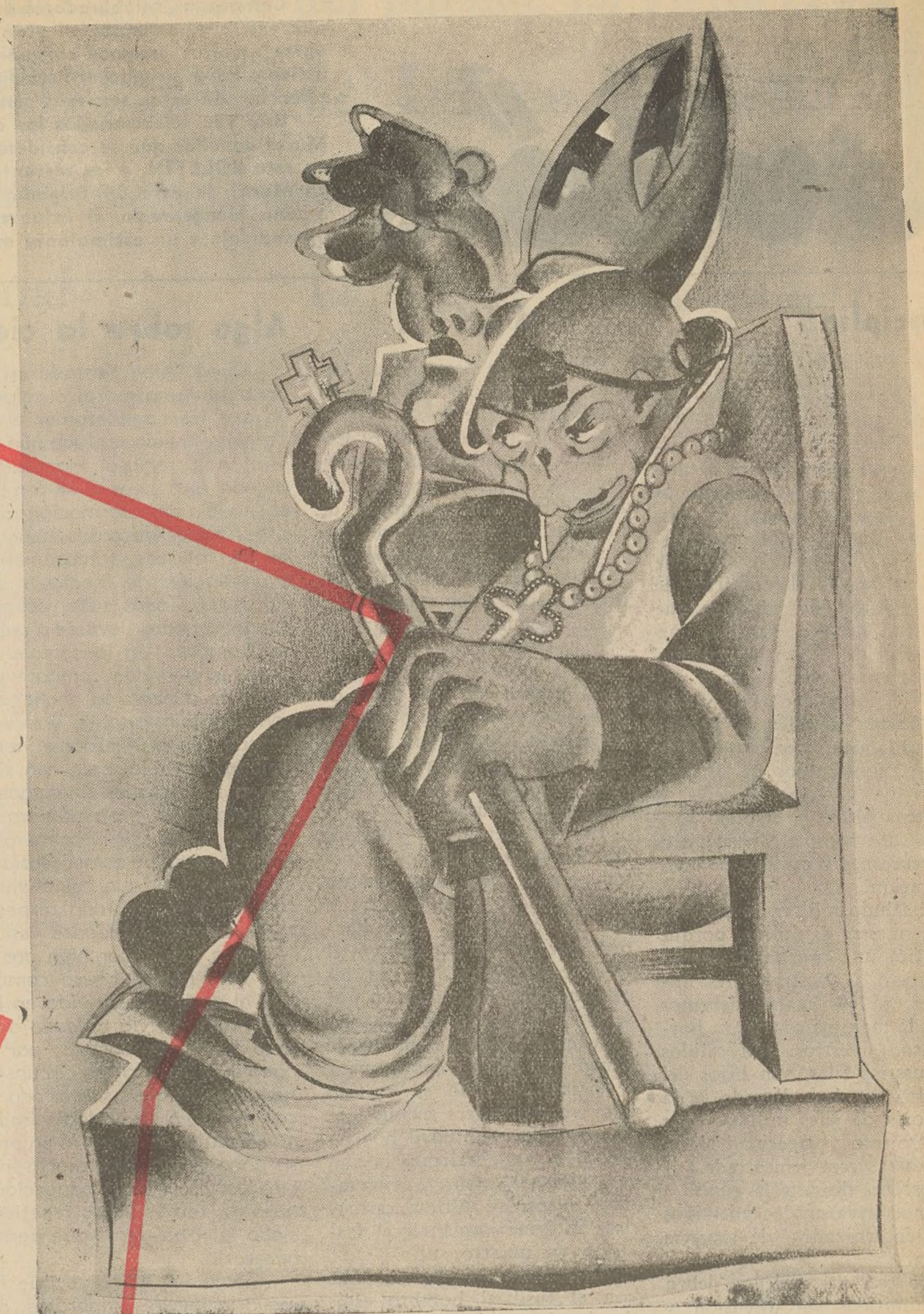
UNA DE CAL Y OTRA DE ARENA

Todo personal tiene derecho al haber diario de 10 pesetas, a la alimentación, con cargo a las 2,25 pesetas que han de reclamar los Cuerpos para el servicio de subsistencias, y a la ración de pan. Los rebajados de rancho sólo percibirán las 10 pesetas diarias y ración de pan, y los hospitalizados y el personal que se encuentre con permiso, no superior a quince días, solamente a las 10 ptas, diarias, sin rancho ni ración de pan. No se autorizarán descuentos o cuotas algunas sobre los haberes de los soldados que no sean las asignaciones que para el envío a sus familiares dispongan las órdenes aclaratorias del Decreto citado, se hará público que no deben efectuarse descuento ninguno, por ningún concepto, en los haberes