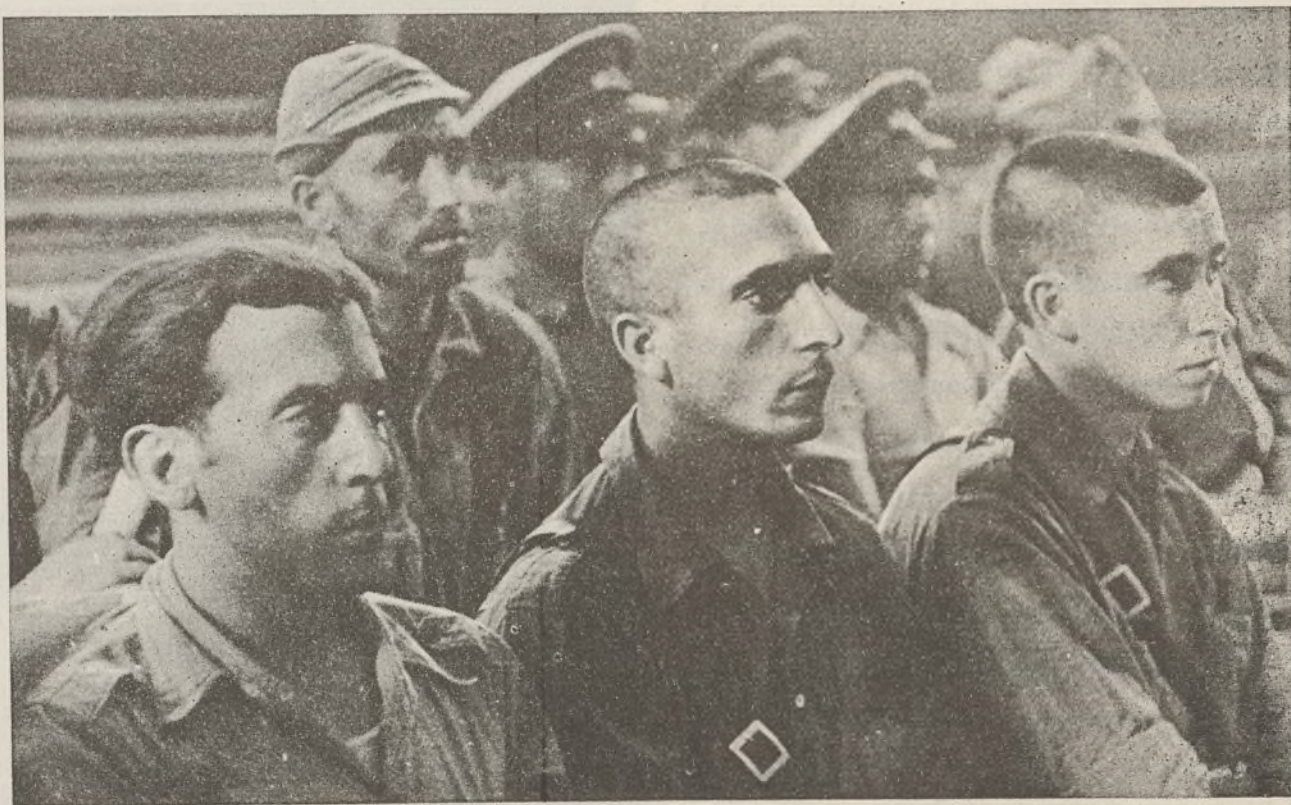
Nuestros camaradas, tanto soldados como oficiales, aprovechan las horas de descanso para elevar su nivel de cultura y perfeccionar sus conocimientos técnicos militares

Esperamos de Sanidad que envíe en mayor número nuestros soldados al Hogar, recogiendo en los hospitales y evitando la evacuación a Levante de nuestros camaradas.