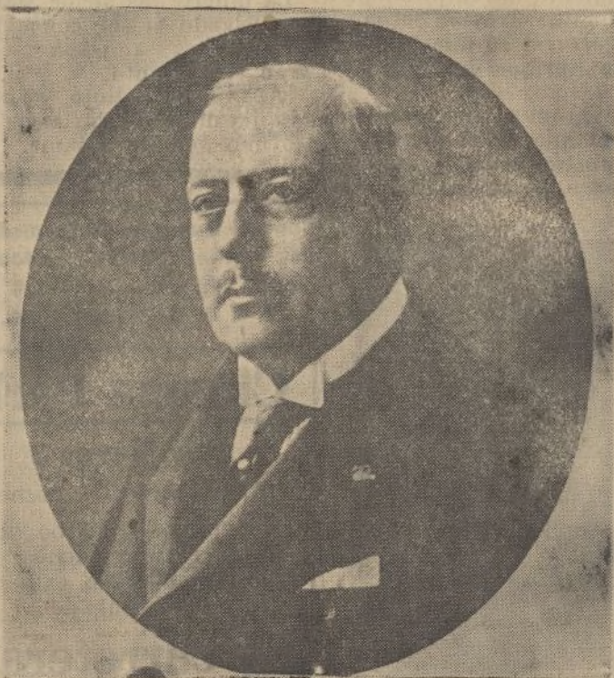
Don Torcuato Luca de Tena, cuyo nombre ilustre vuelve a rotular una de las calles de Huelva, de donde el sectarismo y la estulticia lo desalojaron. Hoy, de nuevo, el artístico zulejo, iniciativa de la Asociación de la Prensa local, con el nombre de «Calle Periodista Luca de Tena» luce, orna y rotula la antigua calle de Valencia.

Entra en materia Martínez de la Riva con un breve y acertado bosquejo de la literatura española a fines del siglo XIX; y entonces, en el año 1891, cuando el genial maestro Menéndez y Pelayo da feliz cabo y remate a su magna «Historia de las ideas estéticas en España»;