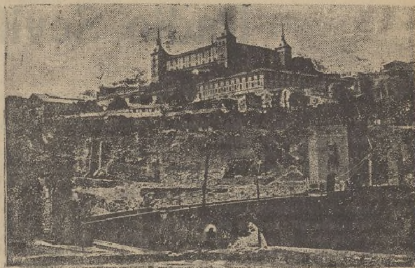
El Alcázar de Toledo, en cuyo interior resisten heroicamente los bravos cadetes de Infantería, con sus profesores

Resumiendo: la situación en todos los frentes es cada vez más favorable al movimiento de nuestras fuerzas. El resultado de las luchas en todos los sectores de combate ha sido francamente a nuestro favor.