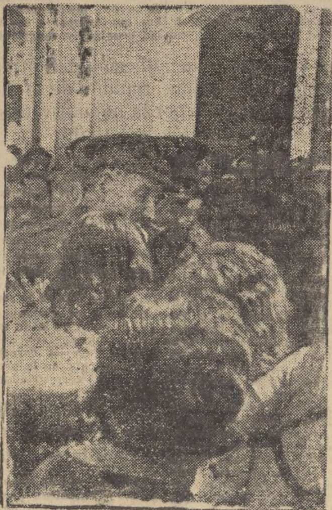
El Excmo. señor General don Gonzalo Quiroga de Llano, abrazado por las simpáticas jóvenes de Cartaya, en su reciente visita a dicho pueblo