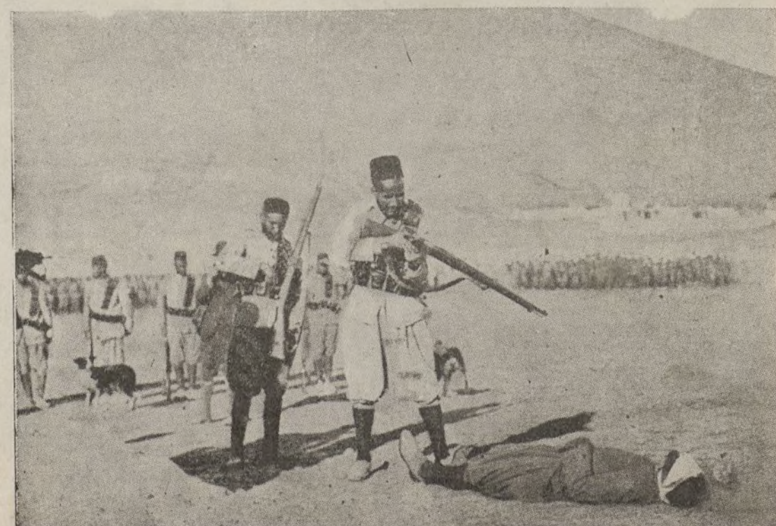
Los regulares—los trágicos salvajes derrotados por nuestros milicianos— durante uno de sus asesinatos.

Por causas ajenas a nuestra voluntad, no hemos podido continuar la publicación de nuestro reportaje "Tragedias de Es- paña", del que acompañamos dos foto- grafías.