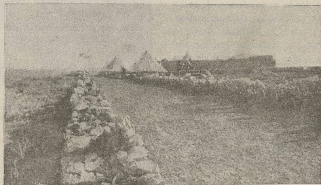
He aquí la carretera que los prisioneros españoles construyeron en Axdir, obligados por los moros.

Por causas ajenas a nuestra voluntad, no hemos podido continuar la publicación de nuestro reportaje "Tragedias de Es- paña", del que acompañamos dos foto- grafías.