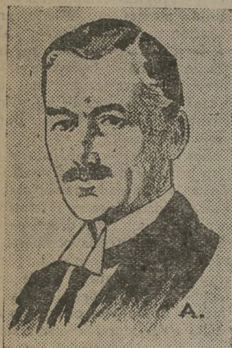
Sir Neville Chamberlain, que precisará la actitud del Imperio Británico en las nuevas deliberaciones ginebrinas. Nos tememos que todo siga igual. Vaseline y dulzura, pero nada más.