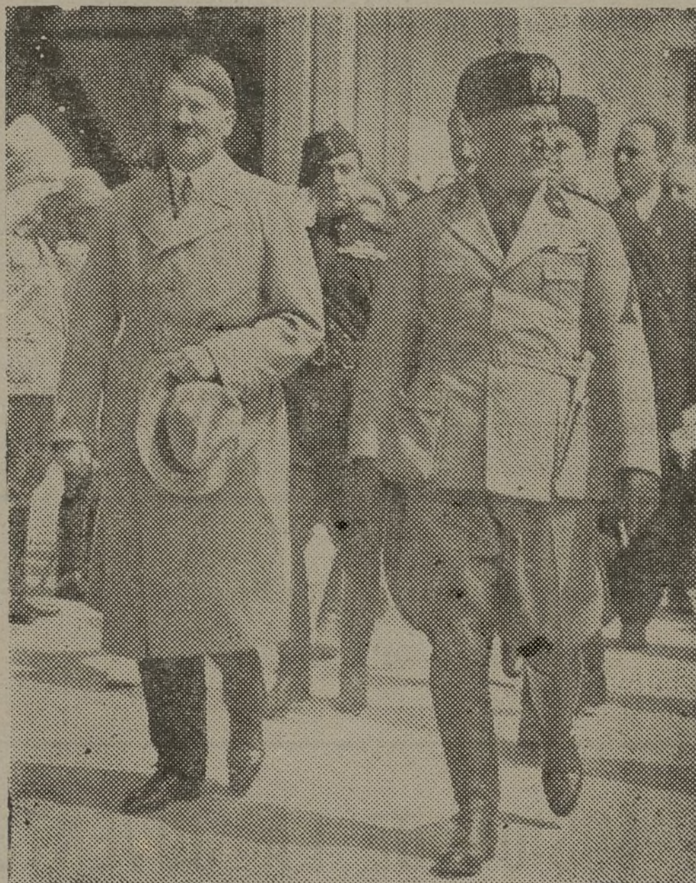
He aquí el trío fascista: Hitler, Franco y Mussolini. ¿Que no veis a Franco, a pesar de estar en medio? Mirad bien. Todo será que como es tan pequeño no sea muy visible.

Si en su lugar actuaran las juventudes, ¡otro gallo nos cantara!