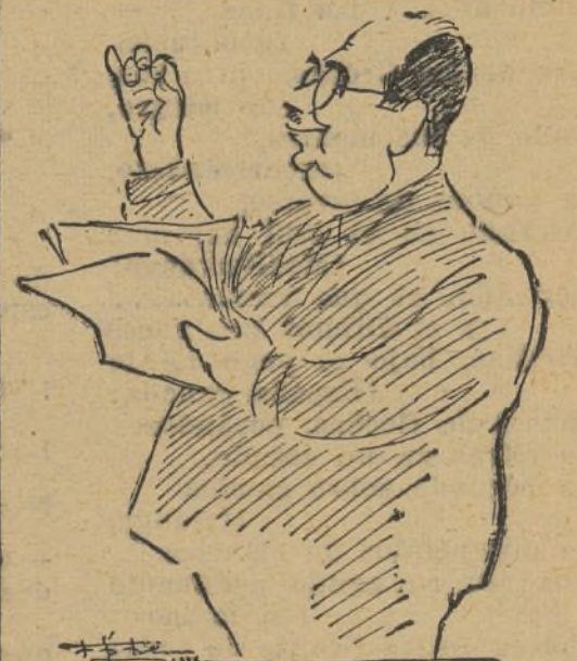
El insigne poeta Eduardo Marquina que recitó una hermosa composición suya en el acto del Casablanca.

acechaban la presa en forma de galeones dotados de rico cargamento.