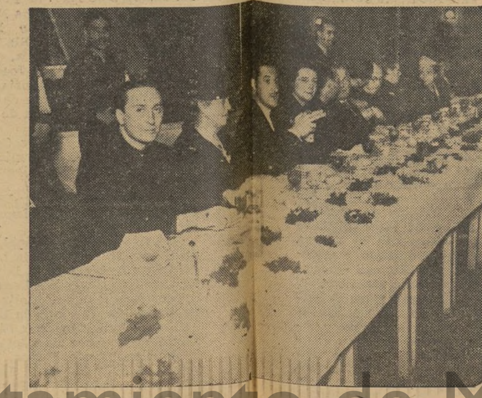
Cabecera de la mesa en la "Cena del Plato Unico" de Casablancá

Y al tercer día resucitó de entre los muertos! como rosas en el frontispicio del mejor de los arcos triunfales, las letras de estas palabras en los Sagrados Evangelios. Antes Jesucristo Nuestro Señor a cuyo triunfo aluden vivió (angustias mortales: en el Huerto de los olivos, levantando los ojos al Padre, necesitaba del milagro, presentía la hiel y el vinagro; los clavos, agujereando sus dulces manos impalpables, la agonía en la cruz y, pasión de pasiones, junto a la