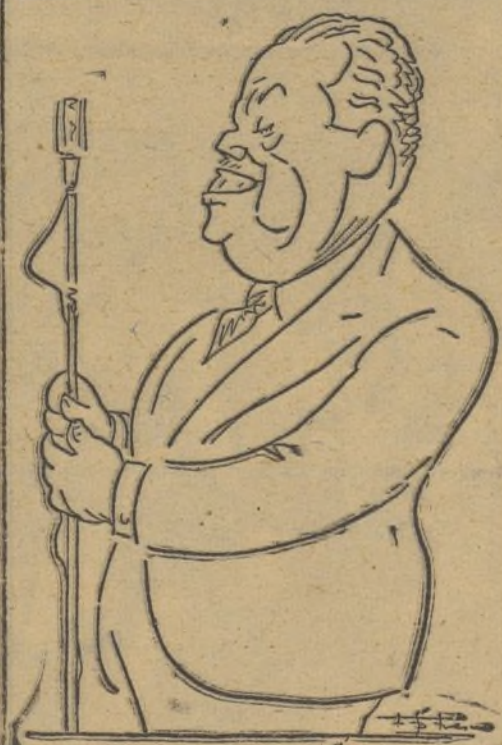
El Conde de Guadalhorce sorprendido mientras usaba de la palabra en la cena del 18 de julio