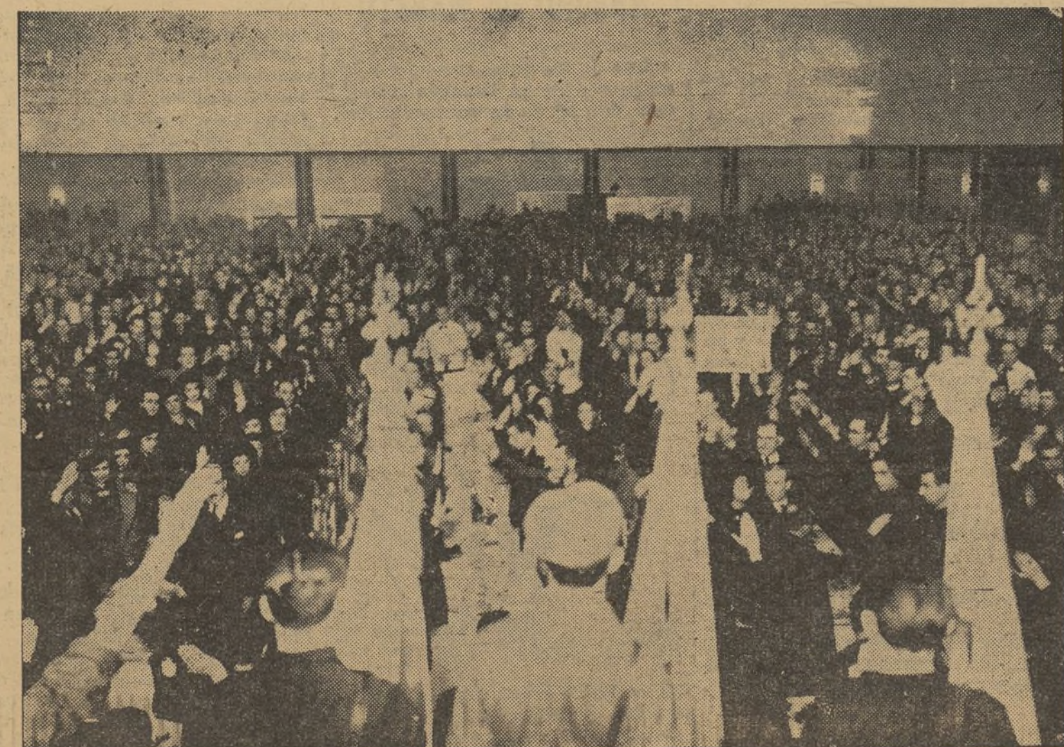
Una vista general de la concurrencia que llenaba totalmente el salón

Y termino, señores: ¡Por la gloria de España! ¡Por la gloria de Franco! por la grandeza de todos los países que nos han comprendido y acompañado, y por la grandeza, también, de la Nación Argentina. ¡ARRIBA ESPAÑA!