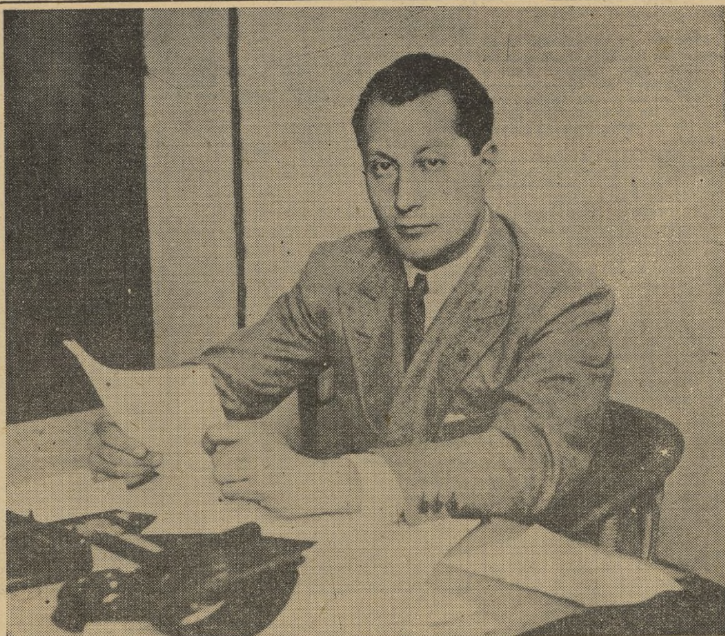
José Antonio, César Joven. Precursor del Imperio

cuando un pueblo — por culpa suya o por culpa ajena — ha dejado enmohecer todos los grandes resortes, ¿cómo va a llevar a cabo por sí mismo la inmensa tarea de regenerarse? Una revolución — si ha de ser fecunda y no ha de dispersarse en alborotos efímeros — exige la conciencia clara de una nueva norma y de una voluntad resuelta para aplicarla. Pero esta capacidad para percibir y aplicar la norma es, cabalmente, la perfección. Un pueblo hundido es incapaz de percibir y aplicar la norma; en eso mismo consiste su desastre. Tener a punto los resortes precisos para llevar a cabo una revolución fecunda es señal inequívoca de que la revolución no es necesaria. Y al contrario: necesitar la revolución es carecer de la claridad y del ímpetu necesarios para amarla y realizarla. En una palabra: los pueblos no pueden salvarse en masa a sí mismos, porque el hecho de ser apto para realizar la salvación, es prueba de que se está salvo. Pascal imaginaba que Cristo le decía: "No me buscarías si no me hubieras encontrado ya". Lo mismo podría decir a los pueblos el genio de las revoluciones.