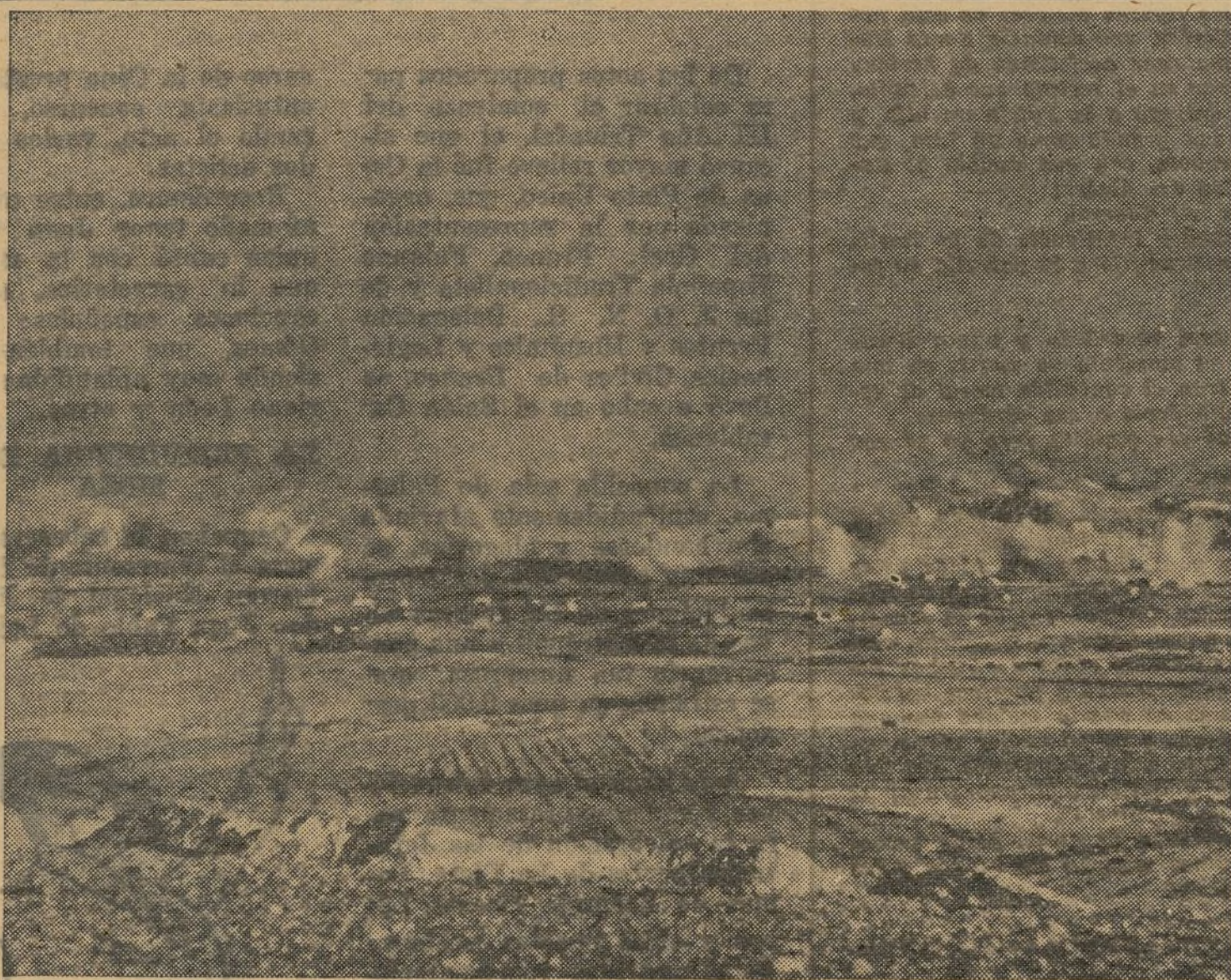
Impresionante aspecto del campo de batalla, en el Frente de Levante, mientras nuestra artillería bate el campo enemigo en preparación del avance de la infantería