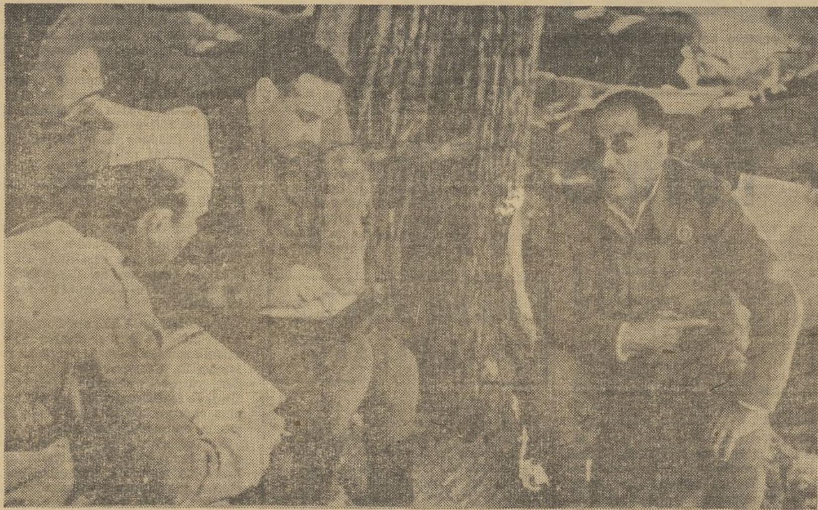
El general Aranda y su Estado Mayor, sorprendidos mien tras estudian en los planos las operaciones del día, en el frente de Levante, buscando la buena ruta para llevar las fuerzas de España a la Victoria