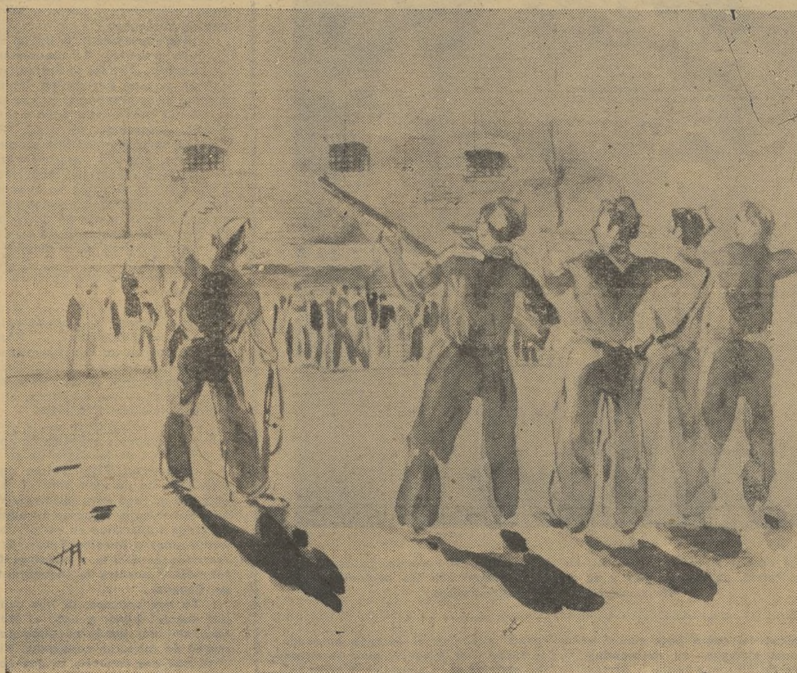
"Pocos contra la pared. No, así no. Más juntos. Cabéis todos"

Las ilustraciones, del natural, son debidas al lápiz de su hermano Javier, que compartió con él todas las vicisitudes de la odisea.