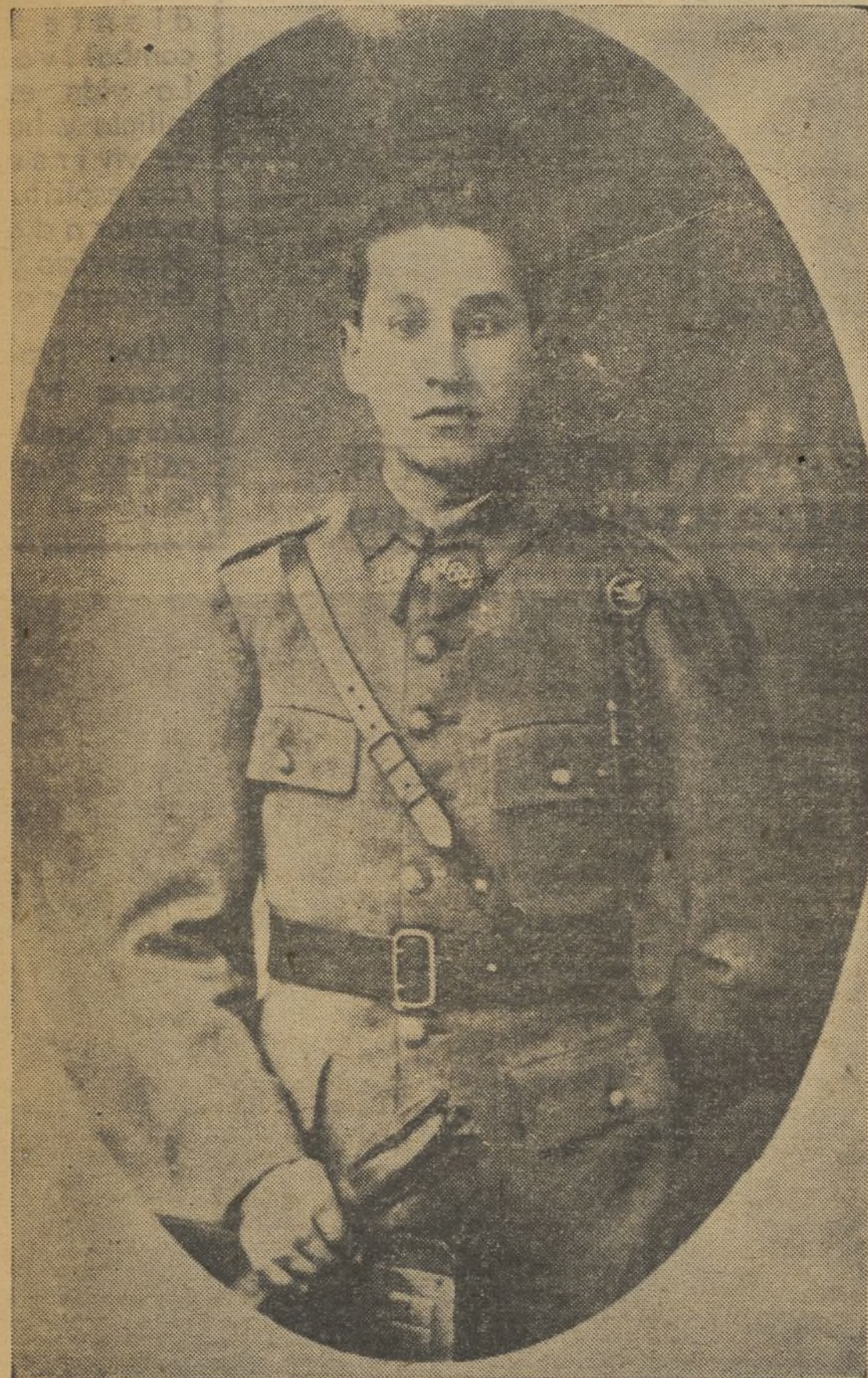
Entre los documentos hallados en posiciones abandonadas en el frente del Ebro se han hallado infinidad de fotos como éstas, de soldados del Ejército Francés, con uniforme completo, que están luchando a favor de los rojos. La "No Intervención"...