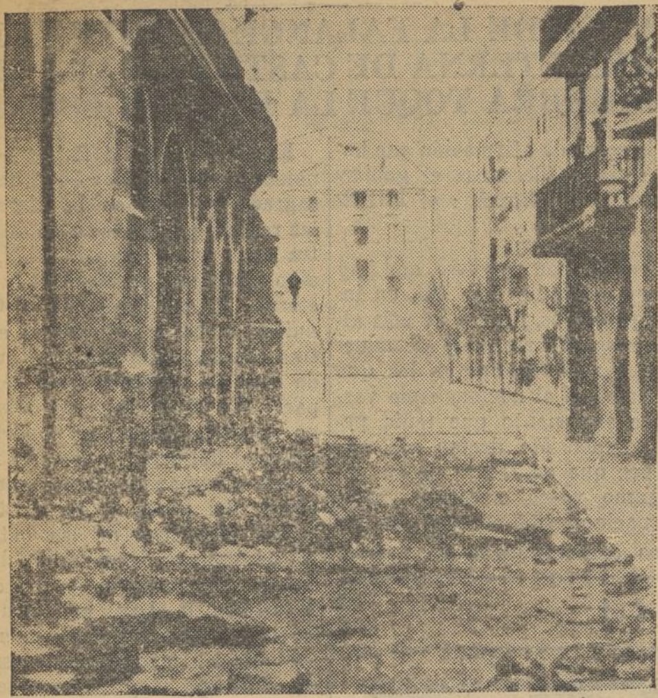
La calma provinciana de la pequeña ciudad levantina ha sido alterada, por algo que parece un cataclismo, pasaron los rojos... En las casas ruinas. En las calles muertas