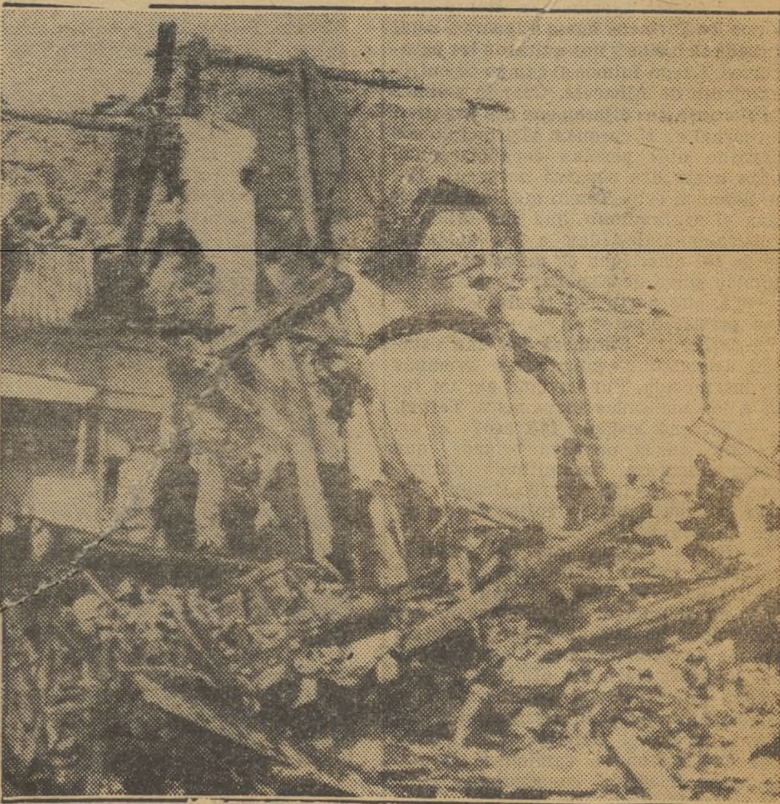
LA AVIACION MARXISTA HACE A VECES FUGACES EXCURSIONES A NUESTRA RETAGUARDIA TRATANDO DE DESAHOGAR ASI SU IMPOTENCIA. HE AQUI EL RESULTADO DE UNO DE ESOS RAIDS A NUESTRAS CIUDADES ABIERTAS