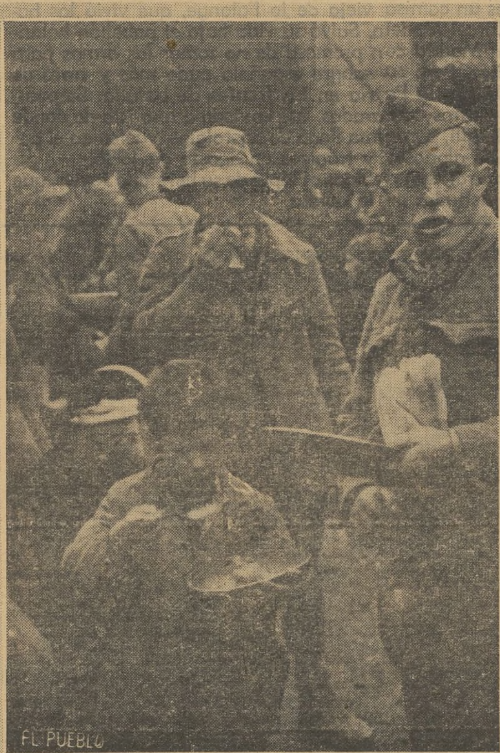
España es una Santa Hermandad, en afán común de Falange. Estos soldados de la Patria, parten su pan y su almuerzo frugal con los pequeños que la furia marxista dejó desamparados