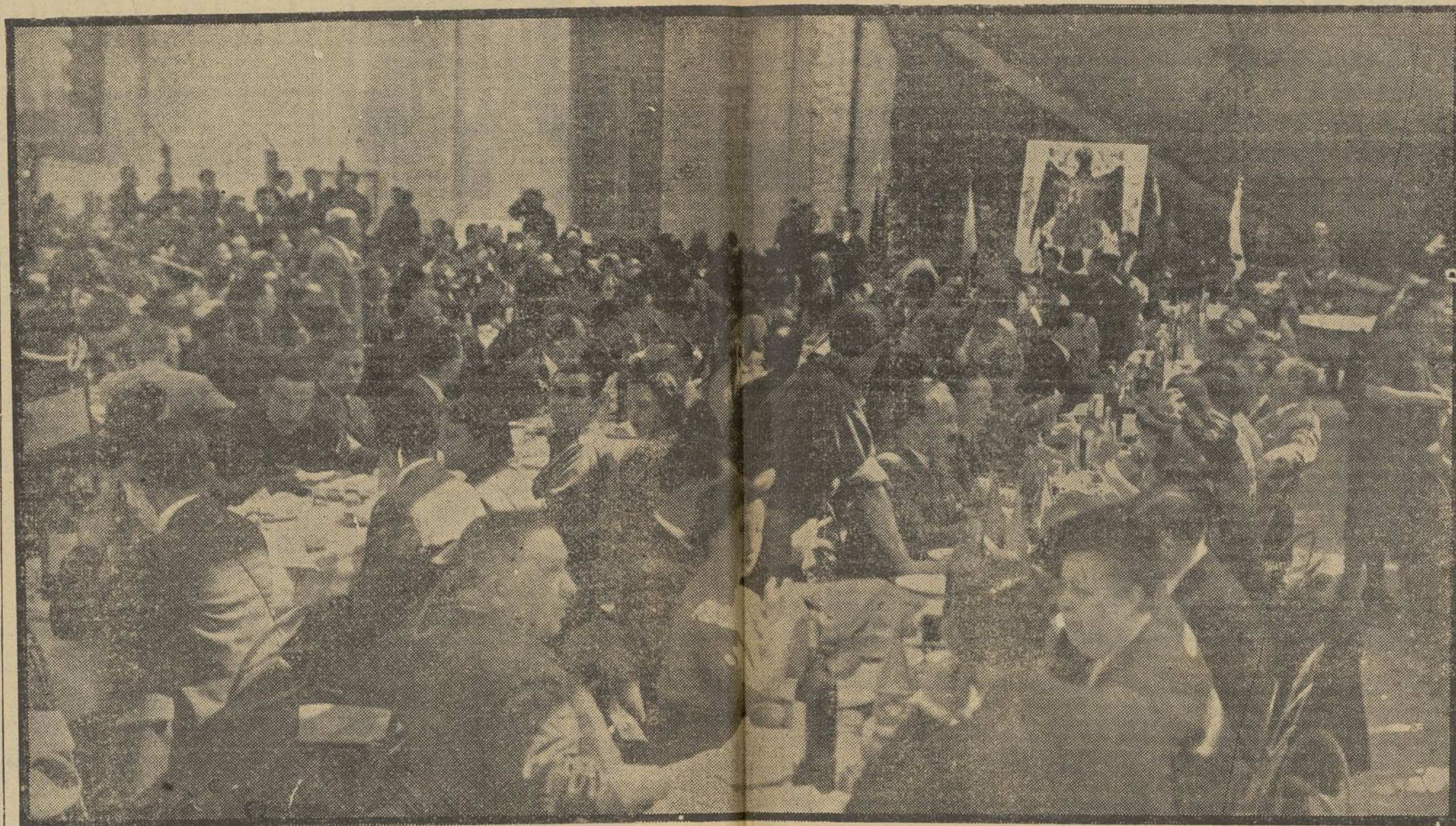
Una vista parcial de la concurrencia que asistió al acto

Este es el día 12 de octubre, en que las tres carabelas, como tres precursoras de las tres Españas finales del