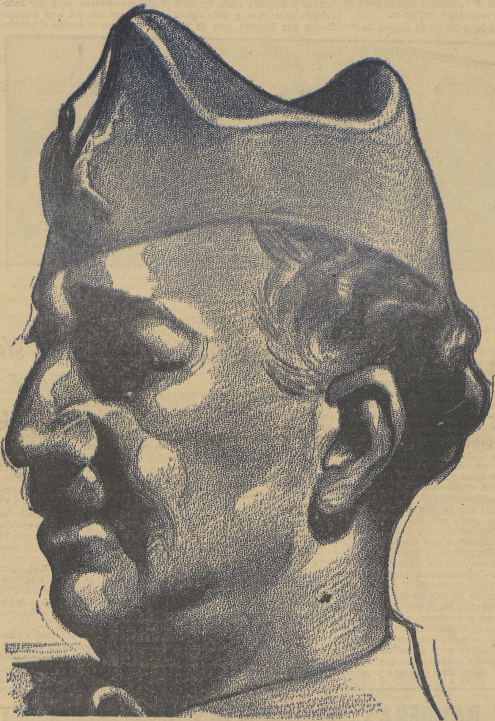
Francisco Franco Bahamonde, Caudillo de España, Jefe del Estado, ejecutor exacto de las Doctrinas del César Ausente, Señor de la Guerra y de la Paz, Jefe Nacional de Falange Española Tradicionalista y de las J. O. N. S. bajo cuya égida España marcha por los derroteros anchos de su destino imperial. En este día lumínico y augural del 29 de octubre, todas nuestras esperanzas de la Patria, Una, Grande y Libre las depositamos en sus manos de Vencedor y Conductor