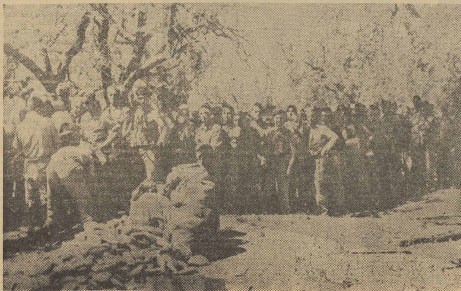
Prisioneros de los tristemente célebres brigadas internacionales, reciben el pan de España, en un campo de concentración de la retaguardia del Ebro