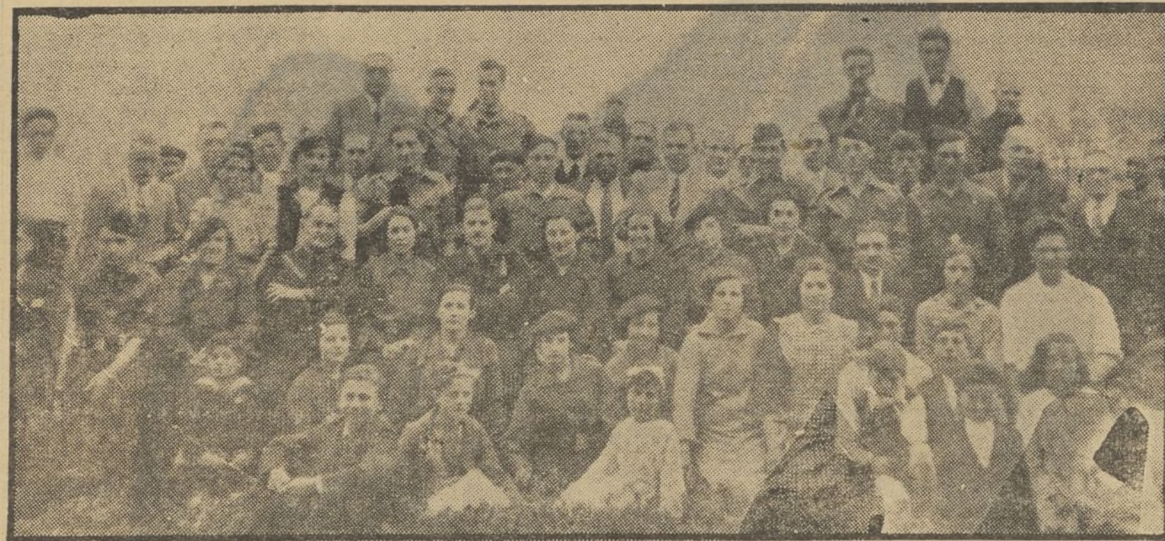
UNA PARTE DE LOS INTEGRANTES DE LA FALANGE DE TRELEW. FOTOGRAFIADOS DURANTE UNO DE LOS ACTOS REALIZADOS CON MOTIVO DE LA VISITA DEL JEFE COMARCAL DE BAHIA BLANCA