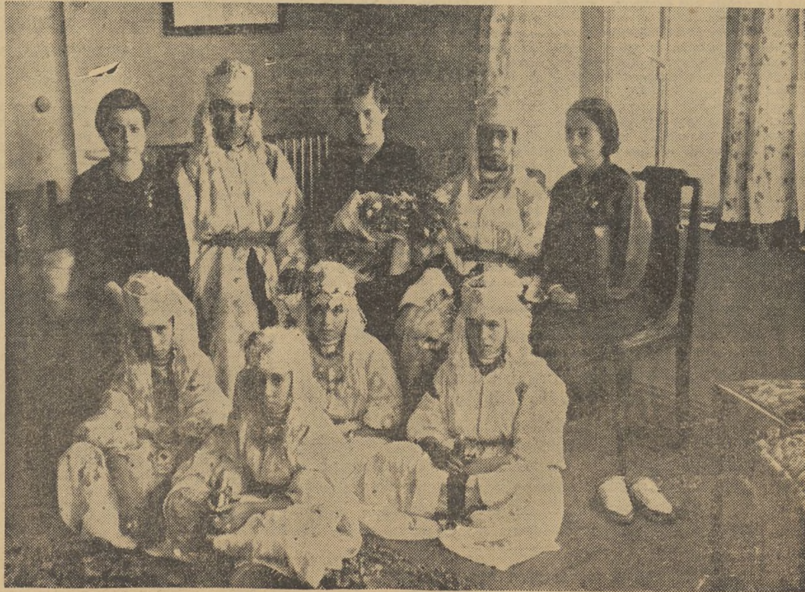
La camarada Pilar Primo de Rivera recibió a las niñas moras que vinieron a España de visita, y se despidió con ellas largo rato, con su natural simpatía y bondad, agradeciéndoles el ramo de flores con que la obsequiaron.