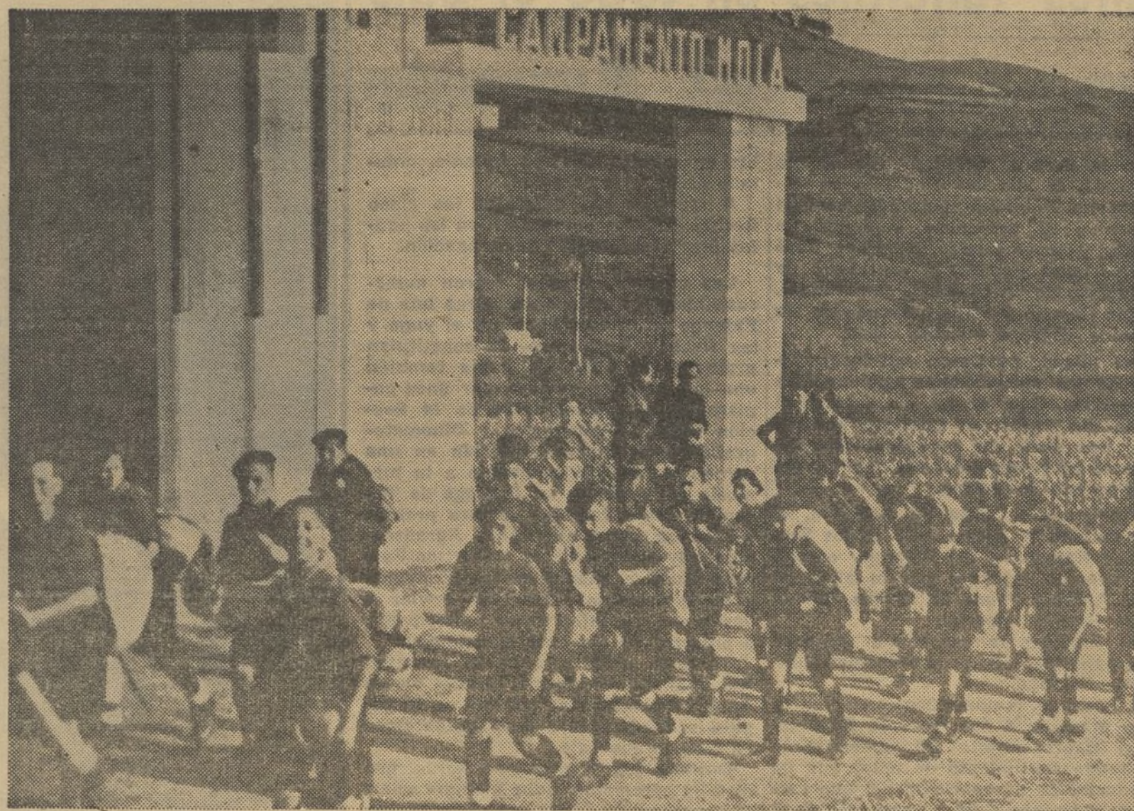
Niños de Falange, esperanza y certeza de España, llegan sonrientes y alegres; tras una fortalecedora marcha, al magnífico campamento Mola, en plena montaña, donde podrán gozar de todas las comodidades que Falange les ofrece