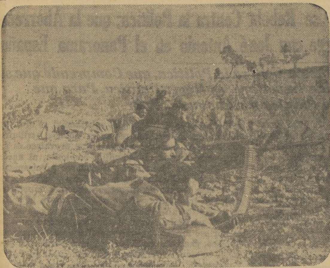
En el frente de Cataluña, sector del Ebro, soldados de España, sirven en plena avanzadilla un puesto de ametralladoras, en los primeros días de la gran ofensiva que acaba de iniciarse y que indudablemente ha de ser para los rojos y sus innumerables "amigos" el golpe de muerte