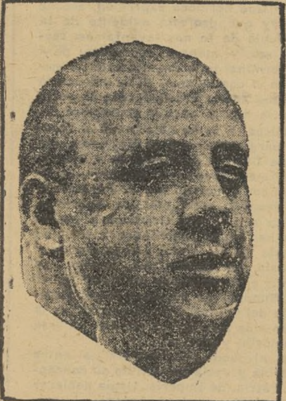
Indalecio Prieto y Tuero.