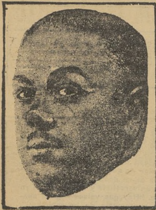
Diego Martínez Barrio.