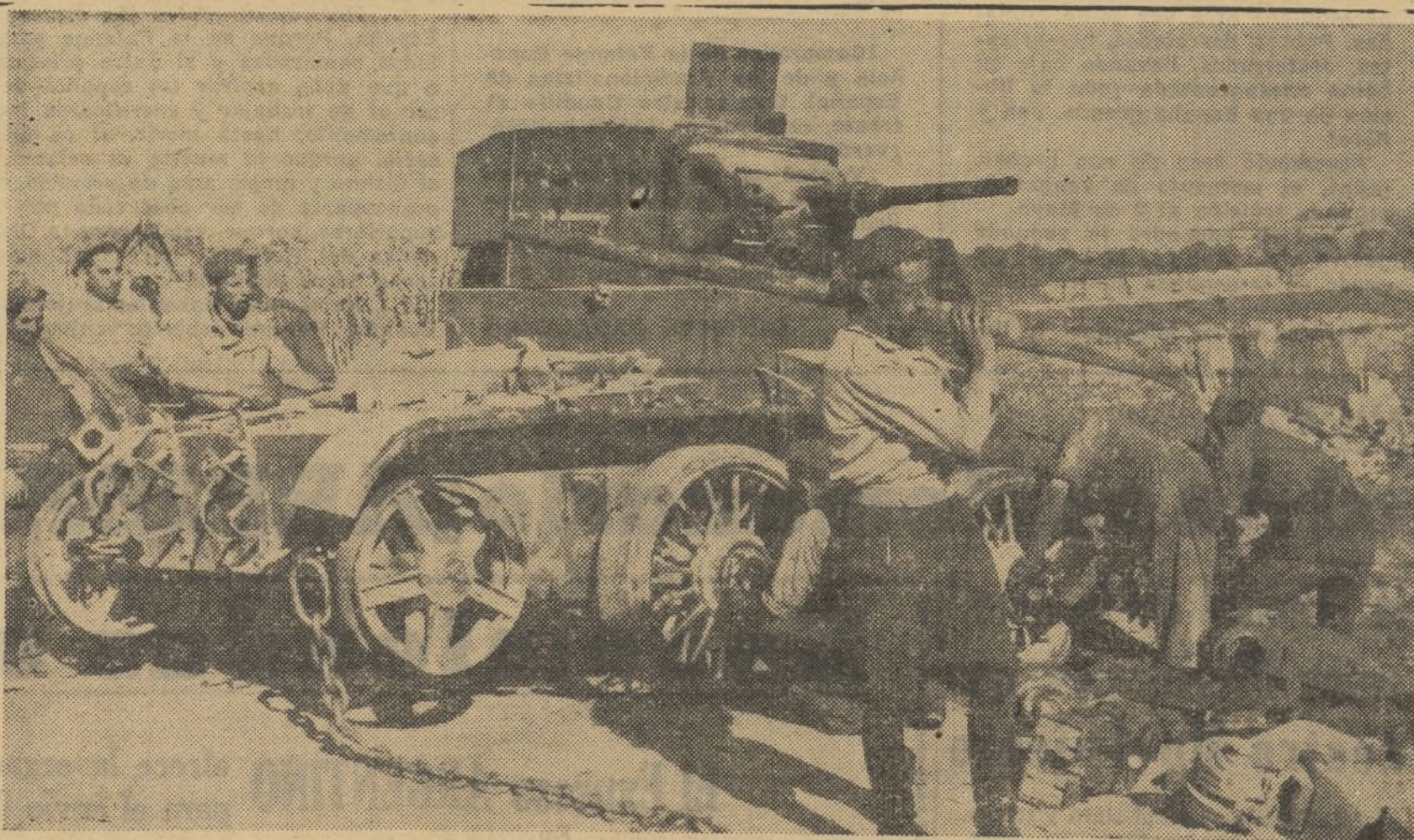
Nuestros valerosos soldados de los Servicios Antitanques, capturan muy a menudo a los marxistas estas modernas máquinas de guerra. El que ilustra estas líneas fué tomado en la reciente liquidación de la bolsa del Ebro

sitiva demostración de paz, que al fin y a la postre resulta vencedora, Inglaterra y Francia, los dos grandes países que en su misma amplitud histórica e importancia actual, deben recoger enseñanzas que les lleve por camino recto y alto, contemplan a Italia y Alemania y es natural que se sientan convencidas por este positivo hecho, de que la buena voluntad de los dos grandes países por la paz, es hecho cierto.