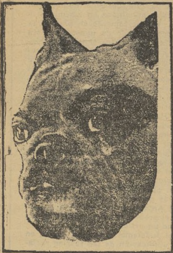
Carnívoro canidac, ditigrado, de garras romas y no contráctiles, orejas semi caídas, prognato, conocido por el nombre de bulldog. Hay raza de Madrid y raza de Sevilla.