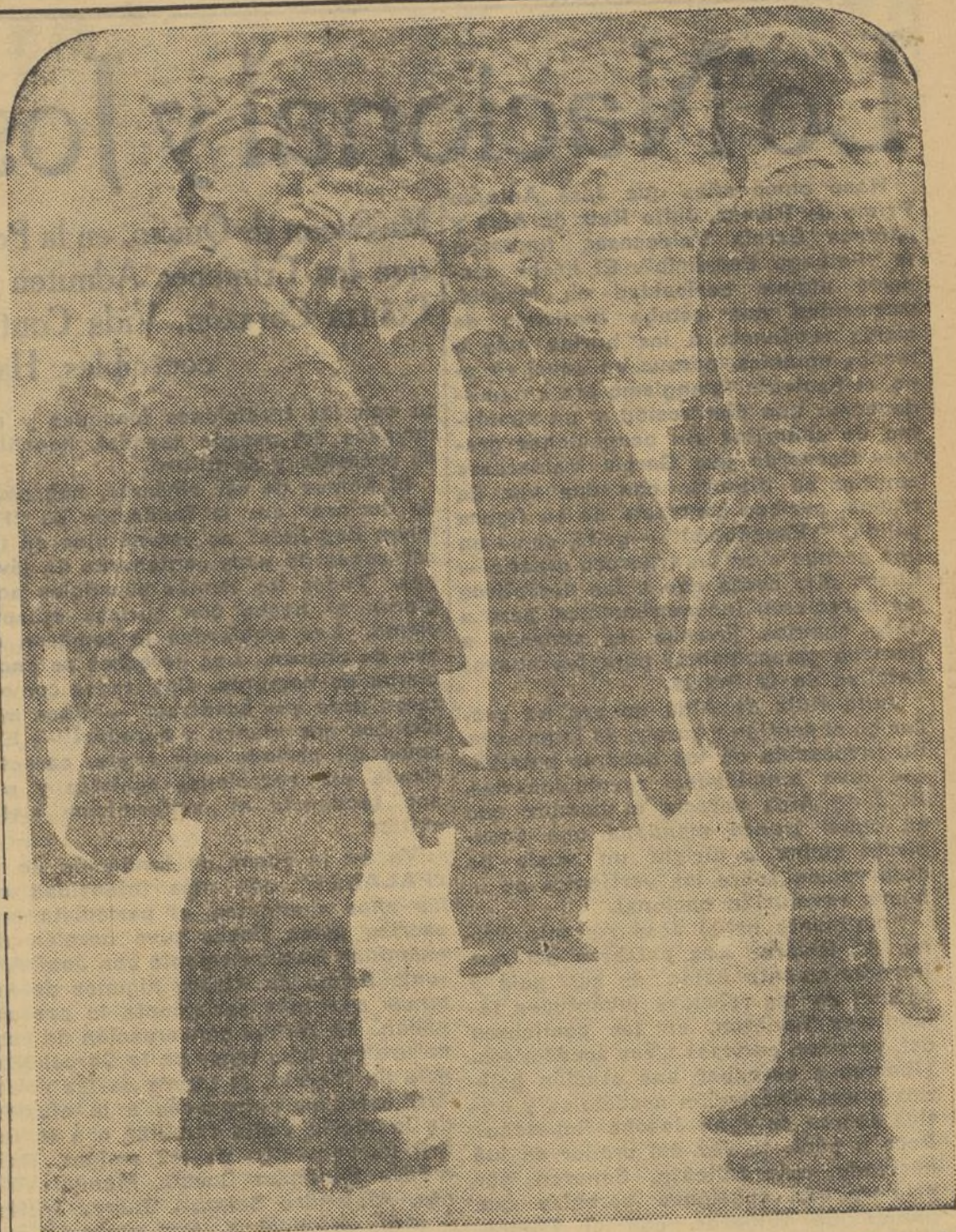
El Generalísimo acompañado de miembros de su Estado Mayor recorre el frente del Ebro, poco después de liquidarse la bolsa