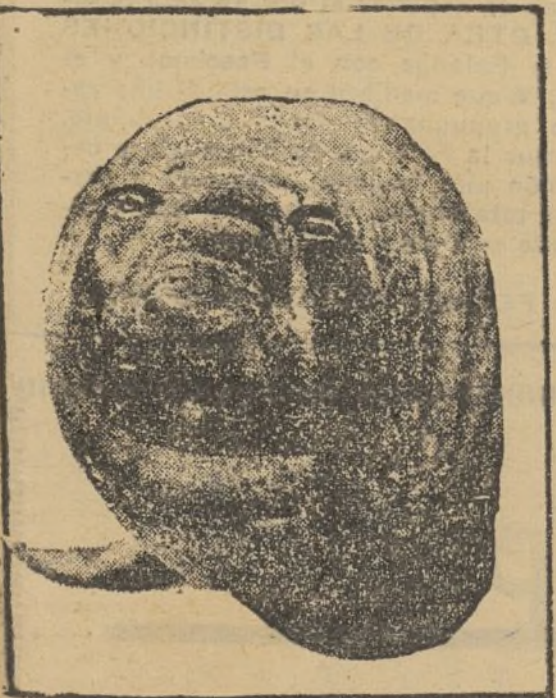
"Trinchechus rosmarus", ejemplar perteneciente a la especie que se conoce vulgarmente con el nombre de morsa.

La dignidad humana, la integridad del hombre y su libertad son valores eternos e intangibles. (Punto 6 del Estado Nacional sindicalista).