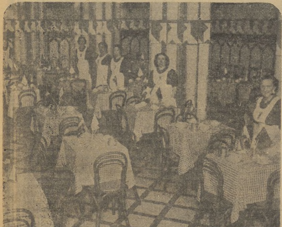
Vista de un comedor organizado por la Sección Femenina de Rosario; copia exacta del de Luarca (España) para ofrecer té a beneficio de Auxilio Social