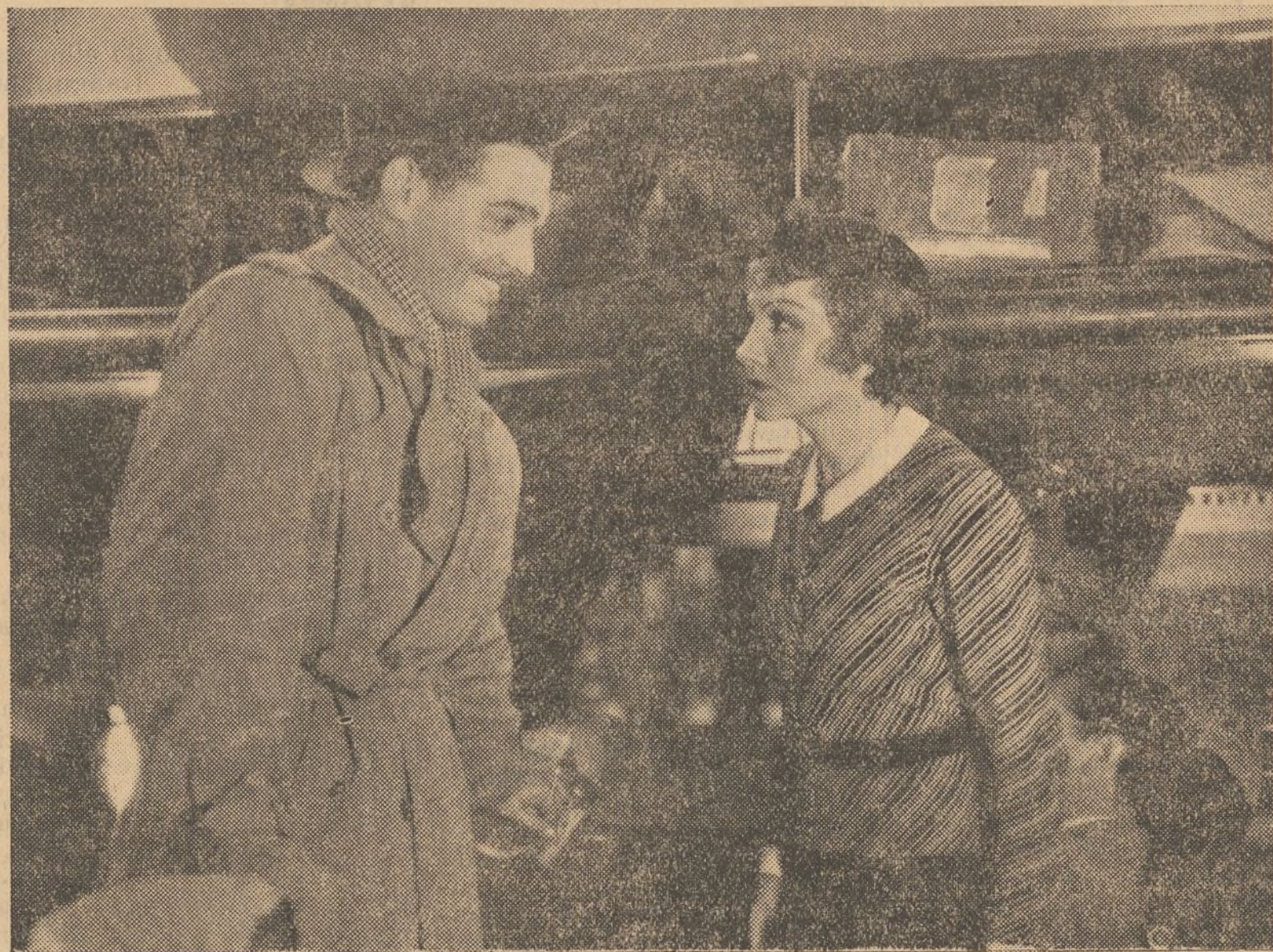
Columbia Pictures ha conseguido llevar a la pantalla juntos en una misma película a dos de sus artistas favoritos. Nos referimos a la encantadora Claudette Colbert y al famoso galán Clark Gable, que aparecen en el presente grabado en una deliciosa escena de la producción de Frank Capra, «SUCEDIÓ UNA NOCHE». CIFESA se anota con la distribución de esta cinta uno de sus más felices éxitos.

Lo último que se pierde es la esperanza y aún no se han quemado todos los cartuchos para enterrarla. Una época de florecimiento y de prosperidad apunta en la distancia. Los tiempos que vienen, traerán más suerte.