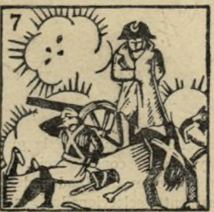
7.-Napoleón Bonaparte gran capitán de su siglo tuvo en Madrid mala parte.