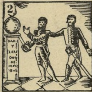
2.-Y probando sin desmayo que su pueblo es heredero del pueblo del Dos de Mayo.