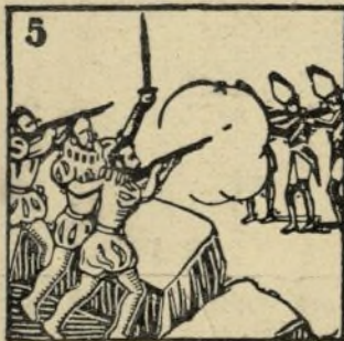
5.-Y los bravos comuneros también tuvieron en jaque a los imperiales fieros.