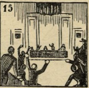
15.-Y tras el rey saboyano su República primera halló el pueblo soberano.