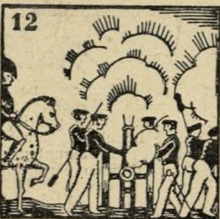
12.-De junio un hermoso día se levantan los sargentos del cuerpo de artillería.