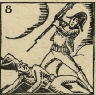
8.-Los milicianos de antaño fueron el siete de julio como los nuestros de hogaño.