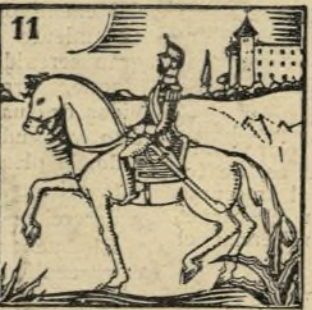
11.-El sesenta y seis sin miedo camina Prim a caballo por los montes de Toledo.