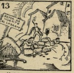
13.-Y hay heroísmo sin fin cuando alza sus barricadas la plaza de Antón Martín.