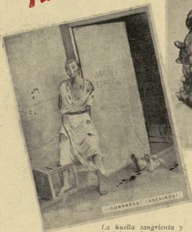
La huella sangrienta y brutal queda estampada por todas partes