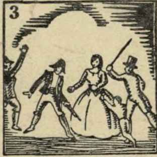
3.-Con fusiles en las manos y en alto los corazones no soportará tiranos.