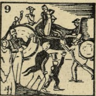
9.-El año cuarenta grita: Viva el regente Espartero Y libre se desgañita.