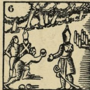
6.-Jugó al bolo y al retruque con los marciales soldados que le mandó el archiduque.