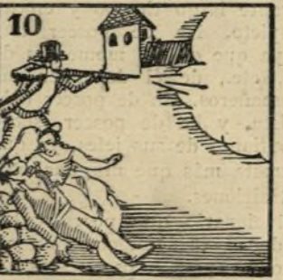
10.-Y el año cincuenta y cuatro de la liberal contienda Madrid vuelve a ser teatro.