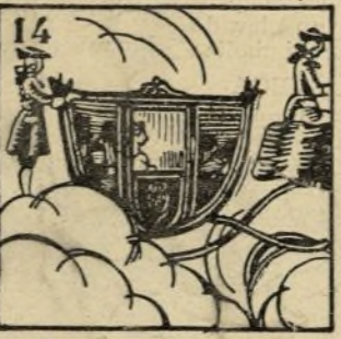
14.-Se produce la gloriosa como en septiembre es llamada la revolución famosa.