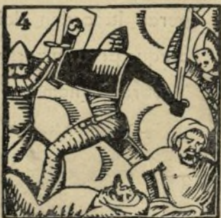
4.-Eché a los moros un día con la furia castellana que de la sierra venía.