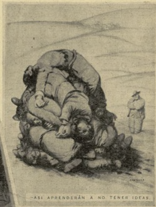
El fascismo criminal e invasor sólo deja a su paso montones de cadáveres

Sentimos odio hacia el fascismo porque sabemos lo que es y lo que significa. Sabemos que es la negación absoluta de la cultura y la civilización. Y nosotros amamos estos principios con íntima emoción. Hemos sabido los hombres del pueblo lo que ha sido el abandono absoluto a que hemos estado sometidos en nuestro país culturalmente. Los gobernantes de la oprobiosa Monarquía se preocupaban hondamente de que las clases humildes no supieran, porque no sabiendo era difícil pensar y, por lo tanto, desconocer absolutamente cuáles eran sus derechos que tradicionalmente les habían negado. Querían tener un pueblo esclavo. El fascismo grita en Salamanca por boca del traidor Millán Astray en pleno paraninfo de la Universidad, sacrilegamente «¡Muera la inteligencia!». Surge el grito rabioso, espontáneo de su alma. Y matan en Oviedo a Leopoldo Alas.