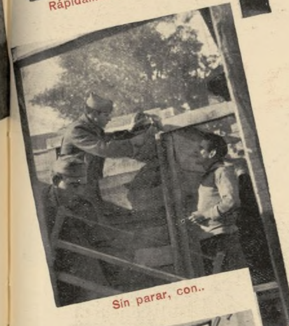
Sin parar, con...