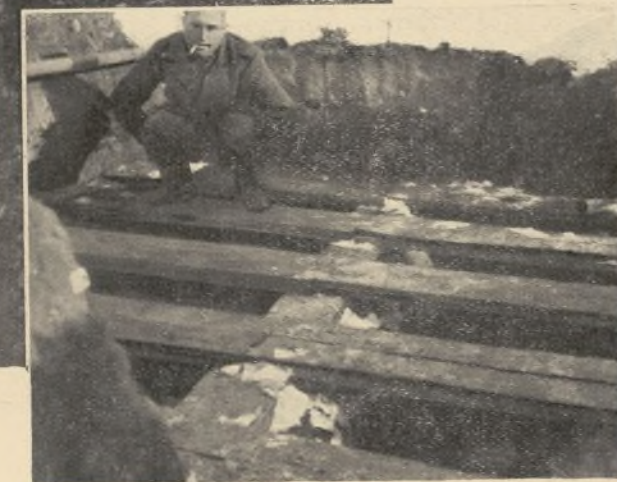
La higiene y la...