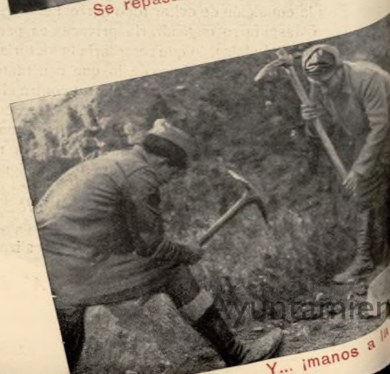
Y... ¡manos a la obra!