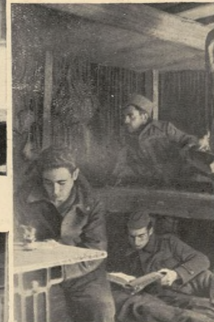
...confort es semejante y aun superior a muchas viviendas.