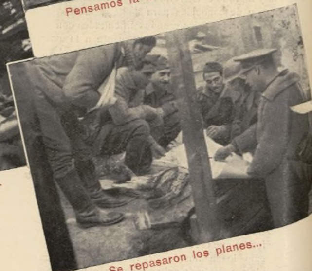
Se repasaron los planes...