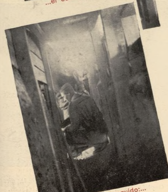
...se ha conseguido...