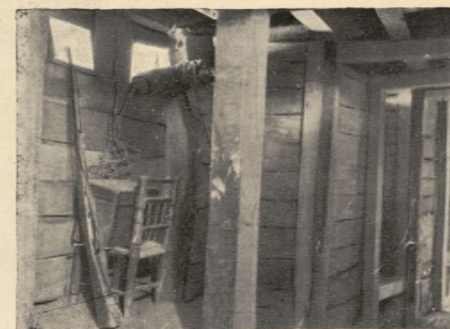
La seguridad y la defensa contra...