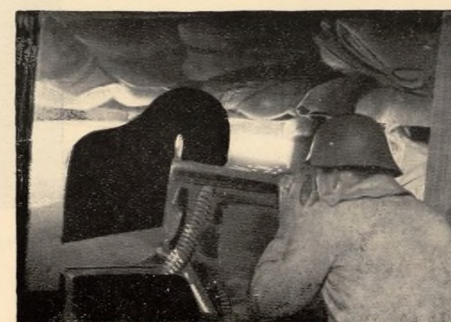
los elementos naturales y los elementos guerreros, es un hecho.