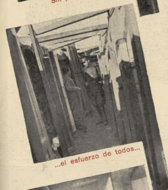
...el esfuerzo de todos...