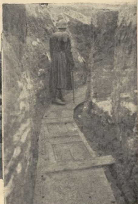
pulcritud, igual en las trincheras...