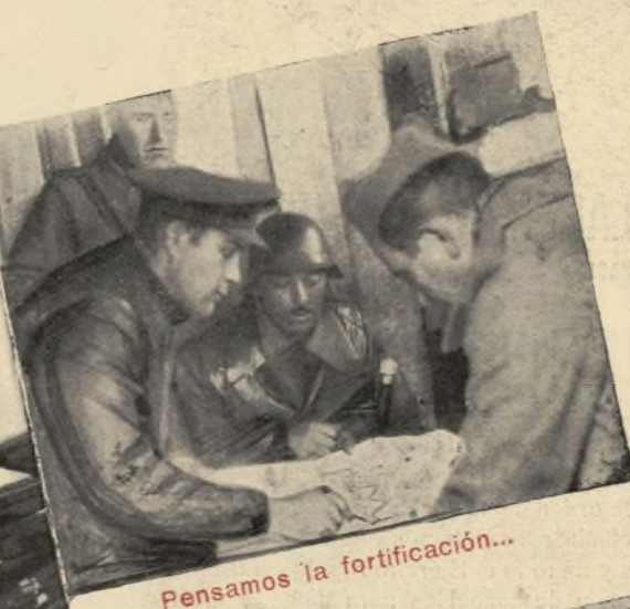
Pensamos la fortificación...