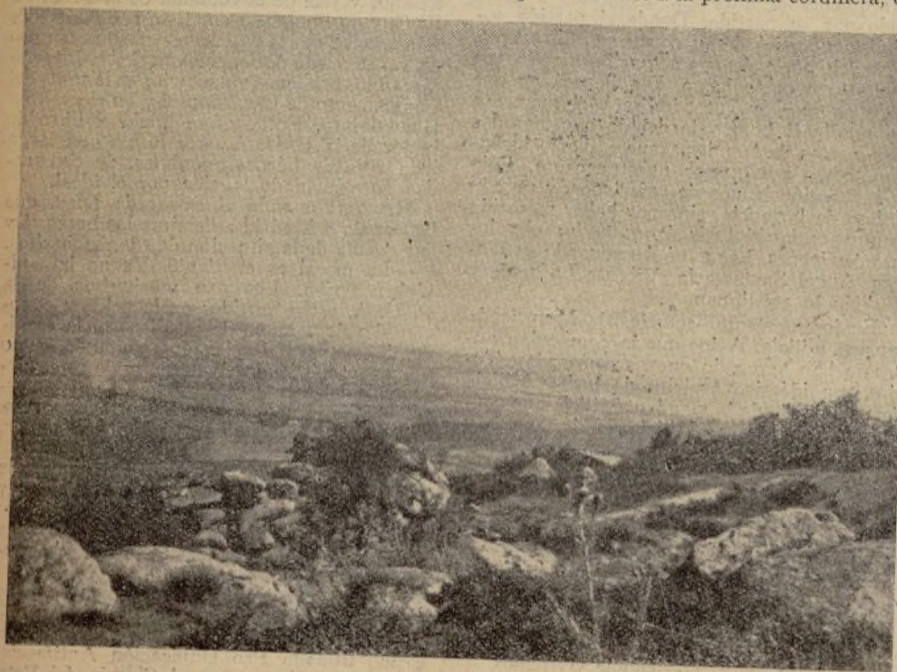
Efecto de la explosión de una bomba de la artillería enemiga.

Decisión y valentía para la conquista de nuestras posiciones. Serenidad para conservarlas ahora y siempre.