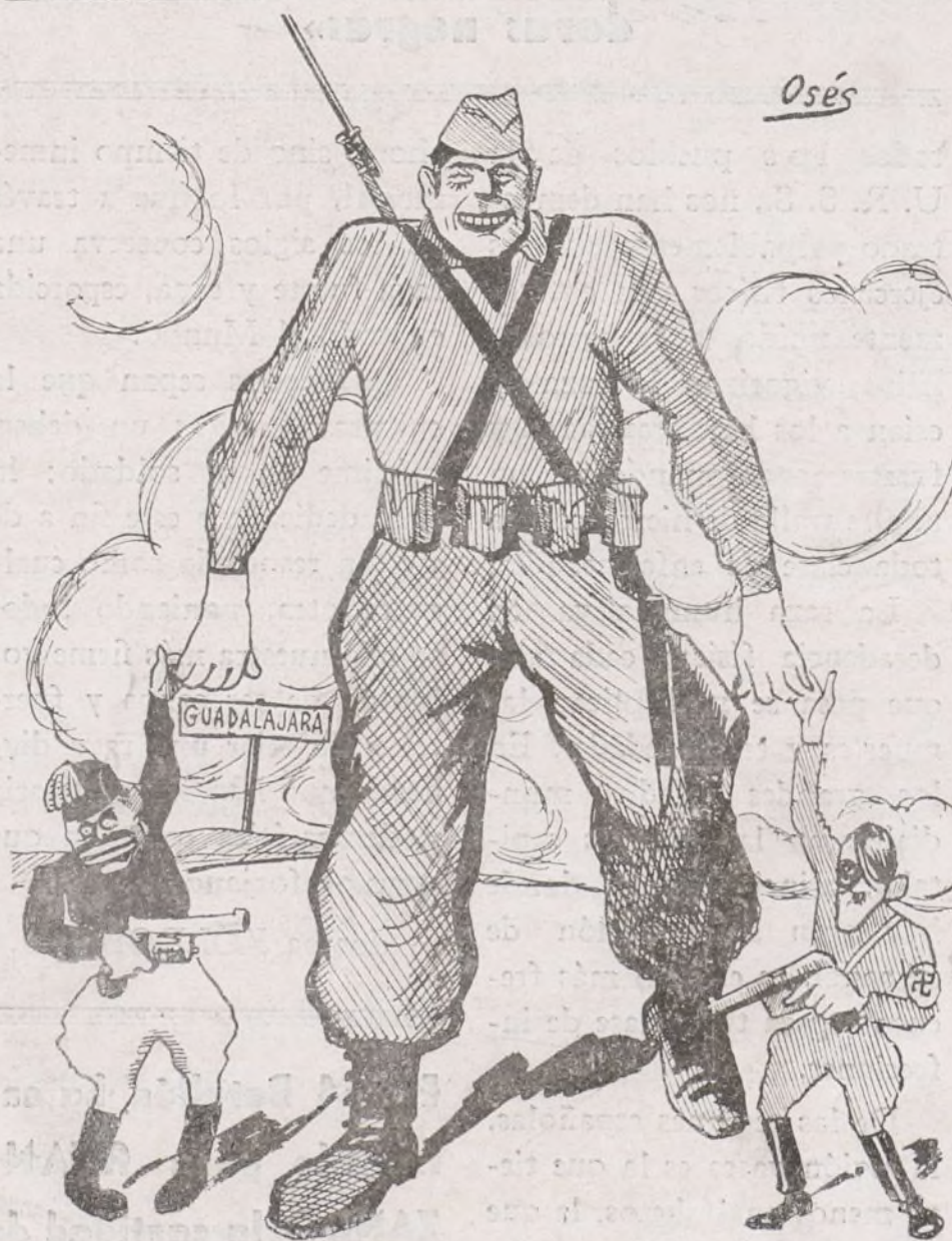
Los atracadores extranjeros