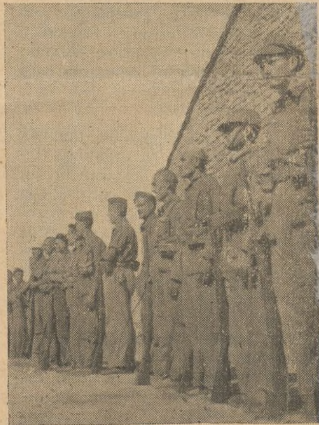
Los noveles soldados, valores nuevos en el Ejército de la Libertad