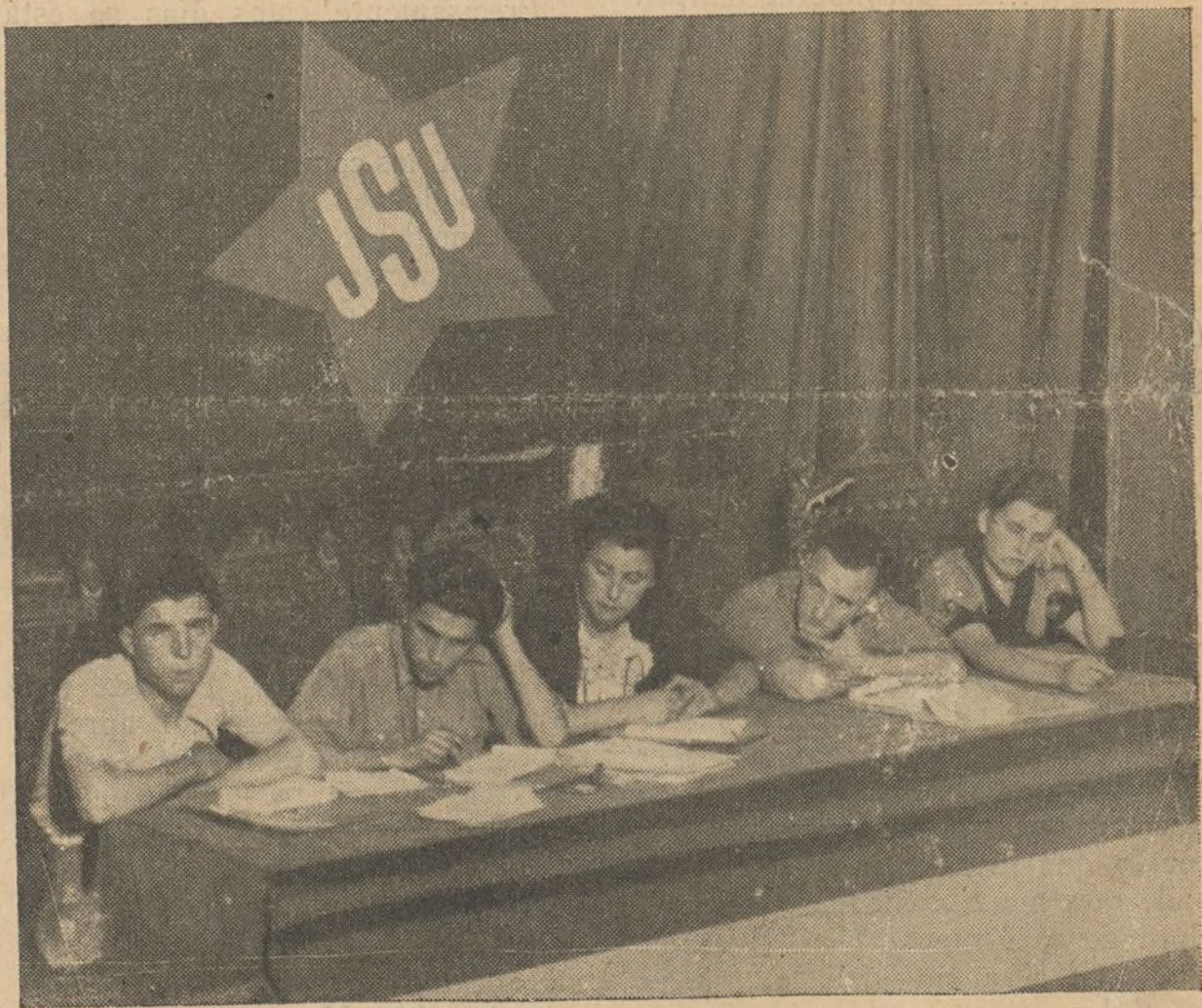
La presidencia de nuestro Primer Congreso Regional de la J. S. U.

Nuestro Congreso marcó claramente el camino a la juventud antifascista de nuestra región, el camino que siguen los jóvenes de Sástago, de Escucha, de Utrillas y de otros pueblos. Este camino está libre para todo el que quiera entender nuestras consignas.