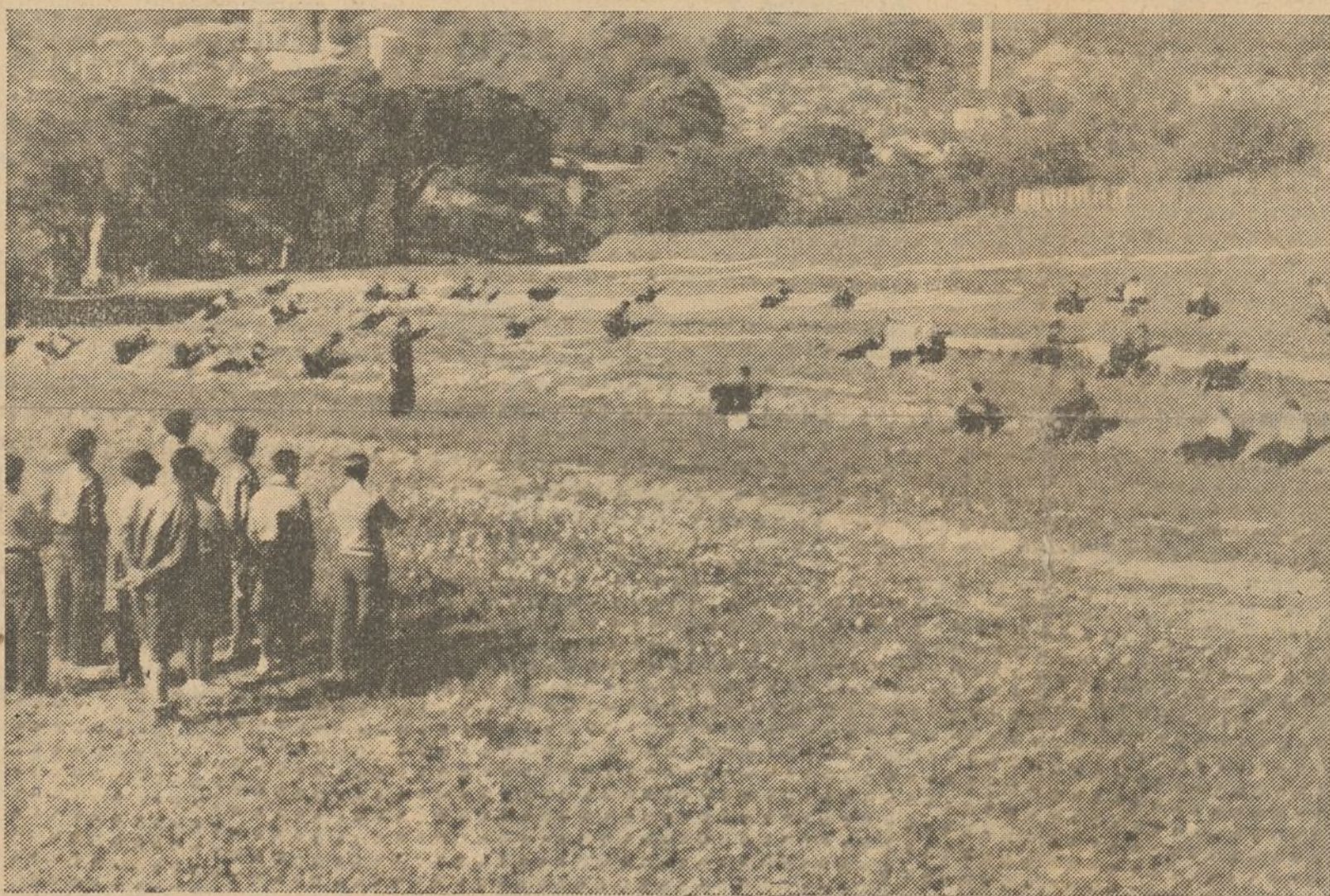
Estos jóvenes que sienten el latigazo de la injuria inferida a nuestro pueblo por alemanes e italianos, con el consentimiento del pelele Franco, hacen ejercicios de preparación premilitar con el fin de estar dispuestos en todo momento a expulsar de nuestro suelo a los invasores