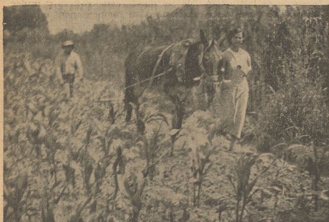
Las compañeras les ayudan...