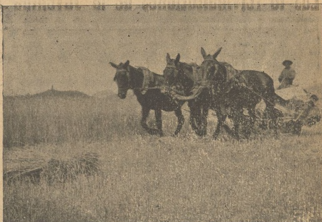
La cosecha se recoge.—¡Bravo camaradas!

Tan sólo se quejan del precio excesivo de las subsistencias, pues ellos venden sus productos al mis-