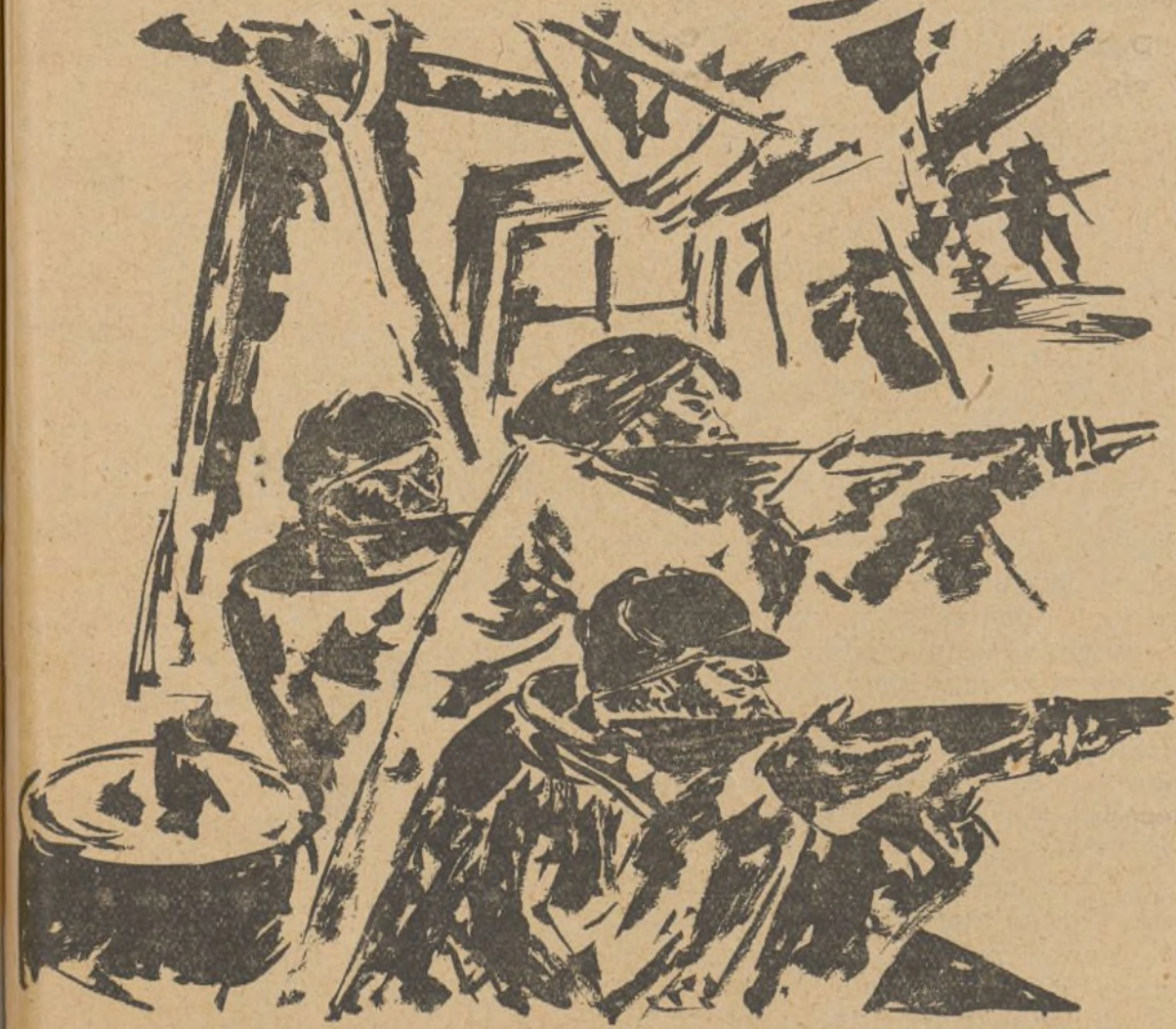
DIBUJO DE SOUTO

La aviación, también ha actuado de firme esta semana. Además de realizar varios eficaces raids de bombardeo, ha logrado establecer combate con los aparatos facciosos en diversas ocasiones. Como siempre, triunfó la pericia y el valor de los pilotos antifascistas. En Bilbao derribaron tres aviones negros, pilotados, como siempre, por "nazis" alemanes. En Madrid, sobre Valdemorillo, lograron abatir tres "Heinkel" y poco después otro "Junker" sobre Majadahonda.