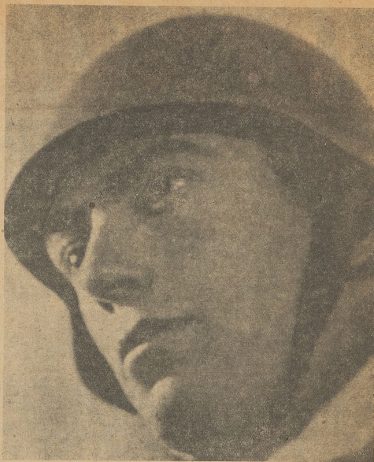
En la Castellana, de Madrid; en la Alameda de Valencia, vemos hacer instrucción a grupos de milicianos, de toda edad y condición, recién arrancados de su trabajo y de su hogar.