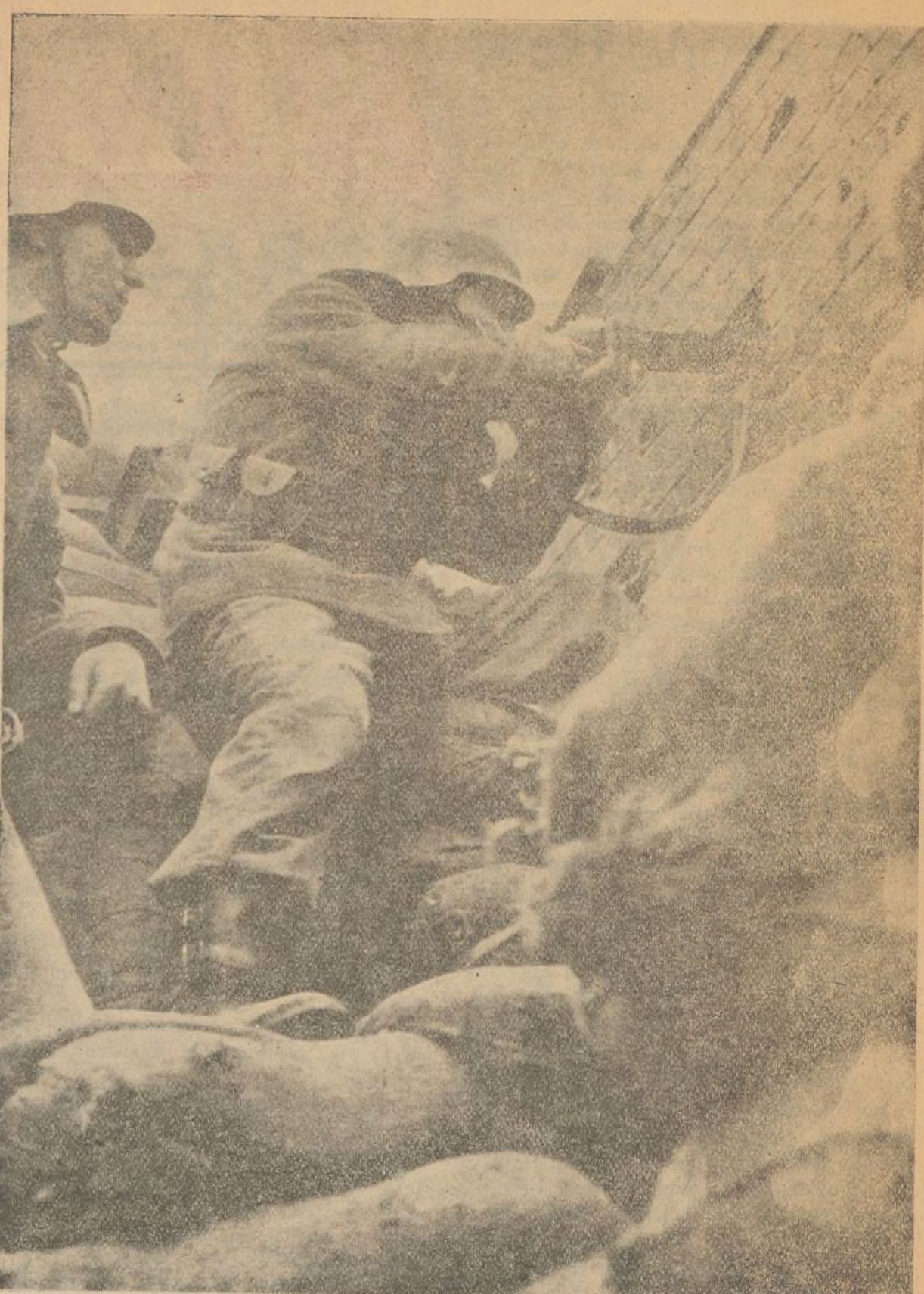
Nuestros soldados disparando desde los muros de Madrid

Ahora esa brigada se ha retirado de España. Ha puesto, como causa de tal determinación, las deficientes condiciones en que han combatido sus voluntarios y la necesidad de cumplir el compromiso de No Intervención por Irlanda, proviéndola de reservas. Sea una u otra la causa, el hecho es que el general O'Dutty, con su brigada al servicio de la traición y en contra de la independencia de un pueblo libre, se ha retirado de nuestro territorio.