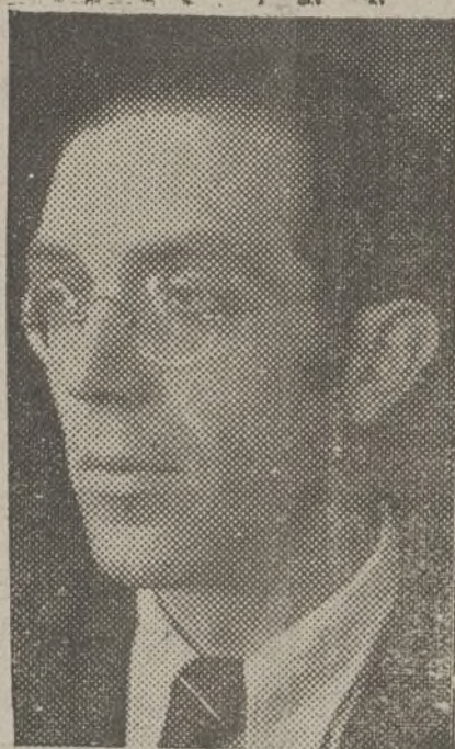
El camarada Jesús Hernández, al que toda la juventud española quiere y respeta por la magnífica labor que para ella viene realizando al frente de su Ministerio.

Esperamos que tomando el ejemplo de Valencia, el Frente Popular de nuestra provincia, trabaje con más actividad que hasta aquí, y sea la base, sobre la que poder resolver todos los problemas que la guerra nos tiene planteados.