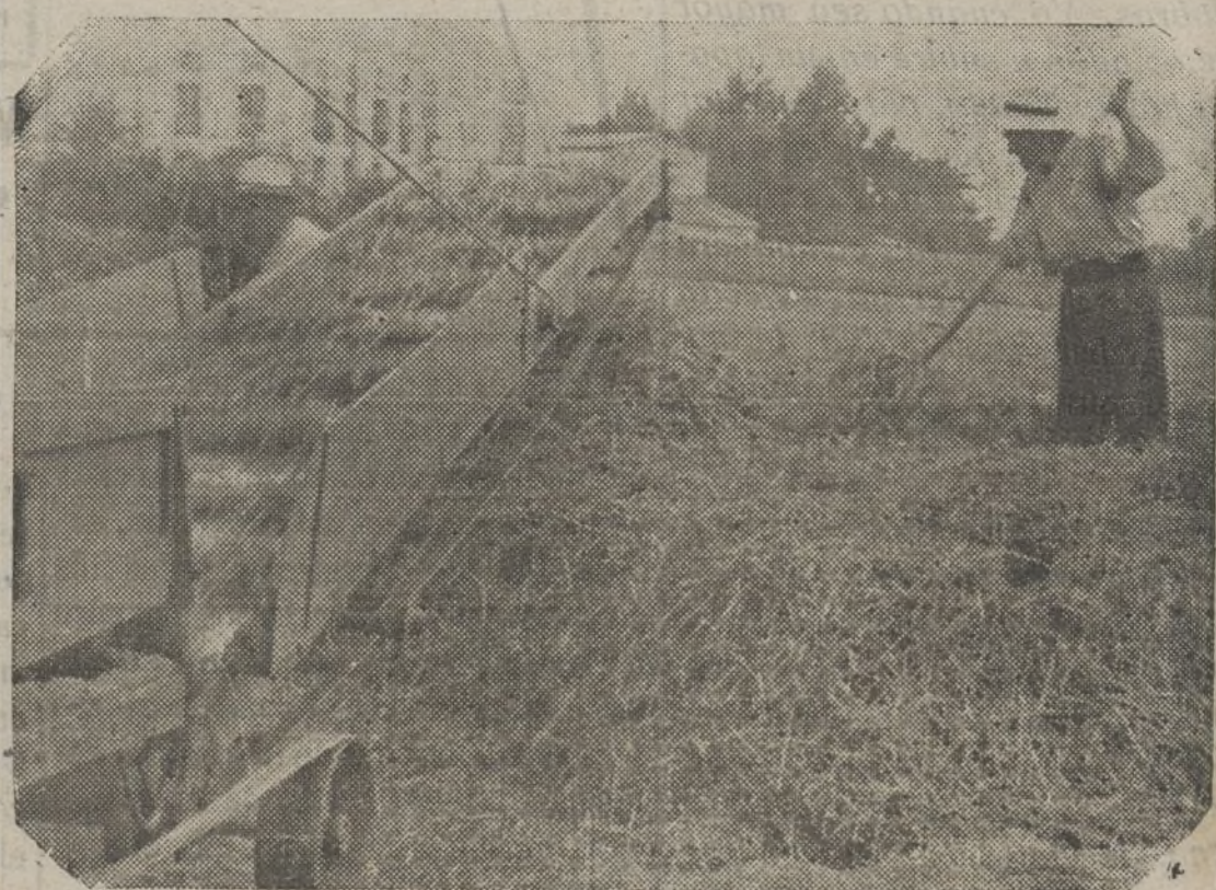
La maquinaria agrícola en poder del campesino constituye una importantísima ayuda para la intensificación de la producción, la cual es preciso aprovechar todo lo posible en beneficio de la guerra y de la revolución

Estos cursillos se limitarán fundamentalmente a examinar las cuestiones relacionadas con la organización interna de las Cooperativas y Colectividades, especialmente las que afectan al trabajo y a la contabilidad. Los delegados que asistan informarán, a su vez, sobre la situación orientaciones, etc., seguidas en cada provincia como intercambio de experiencias.