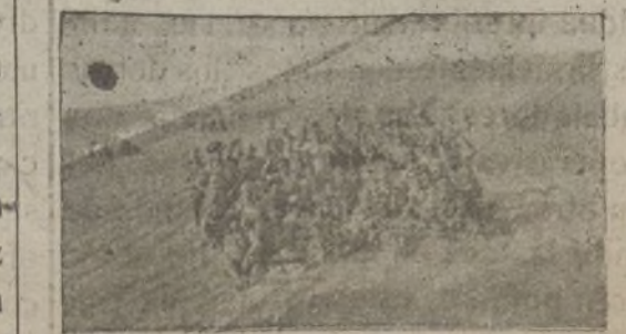
Un grupo de soldados de la República