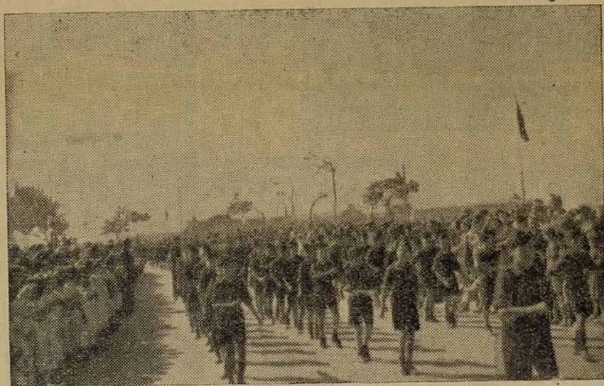
Os vemos pasar camaradas, una y mil veces, y cada vez nos atrae más el deseo de veros desfilar. Pecho afuera, fuerte la pisada, alta la frente, braceo por igual; formalidad, disciplina absoluta, que el pueblo os vé con harta complacencia. En esta foto, también os veis vosotros. Mirad que mal hace cuando no hay absoluta uniformidad de movimiento.

La voluntad es suficiente. A cada tropezón, diremos: ¡Arriba España!