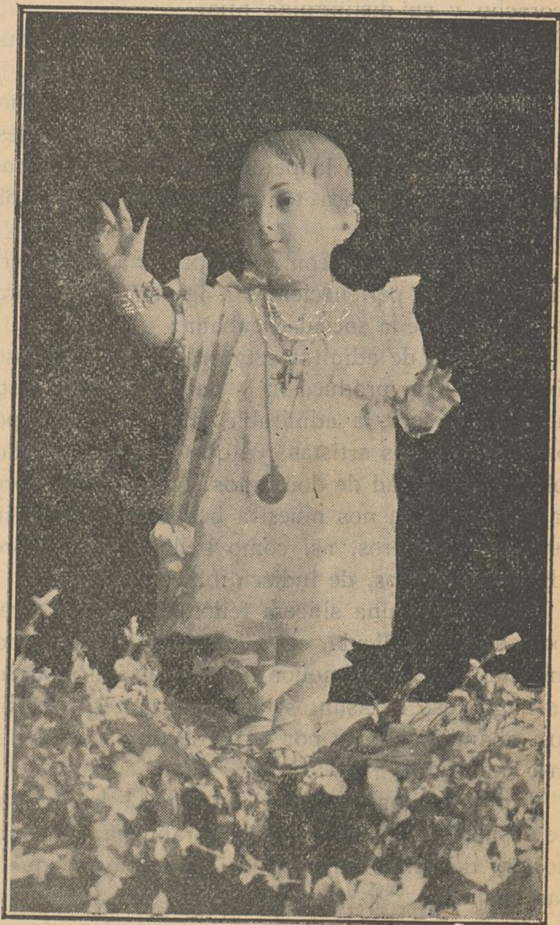
Niños ricos: Este niño, que vosotros amáis, os pide juguetes para los niños pobres de Villa de Don Fadrique, y si no tenéis hambre, la mitad de vuestra merienda.