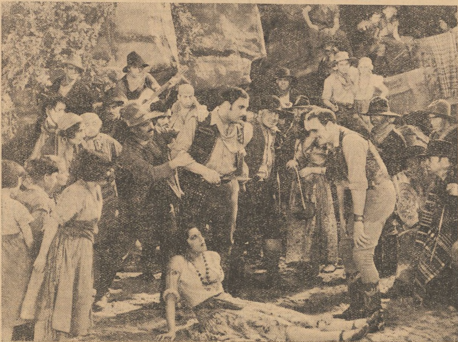
Una interesante escena de la graciosa producción de British International Picture, «La chica de las montañas», distribuida por CIFESA, que será presentada hoy en nuestra ciudad.

Bajo este aspecto, «El vuelo de la muerte», es una producción hispanoamericana que recorre, sin interrupción, todos los cines del mundo. Ha sido filmada en los estudios de Méjico, bajo la dirección de Ramón Pereda y hablada en castellano.