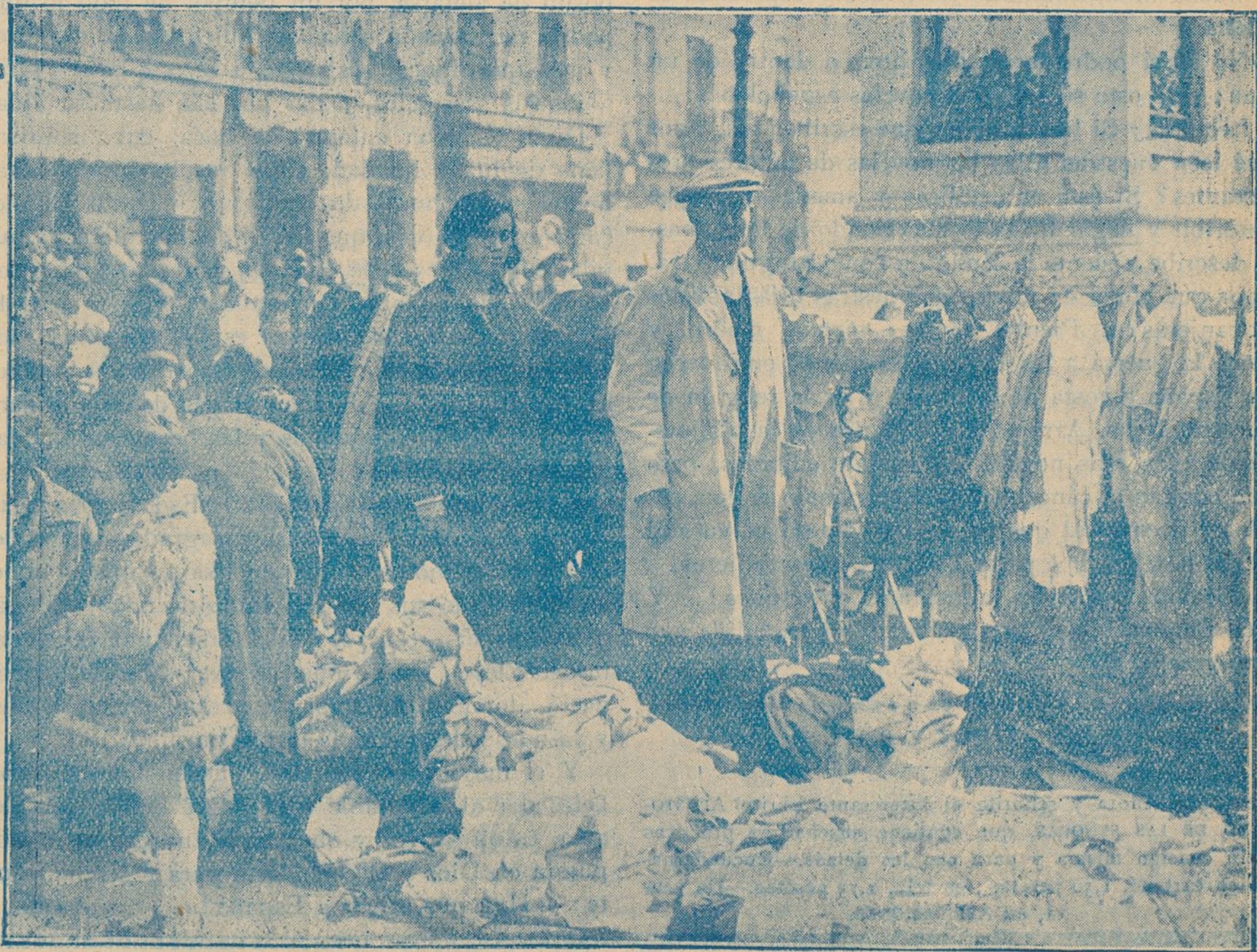
De la interviu celebrada por nuestra colaboradora Srta. Isabel Alvaro en las Américas del Rastro.

PRECIOS DE SUSCRIPCION: Para España: Semestre, 2,50 pesetas. Año, 5 pesetas. Extranjero: Año, 10 pesetas