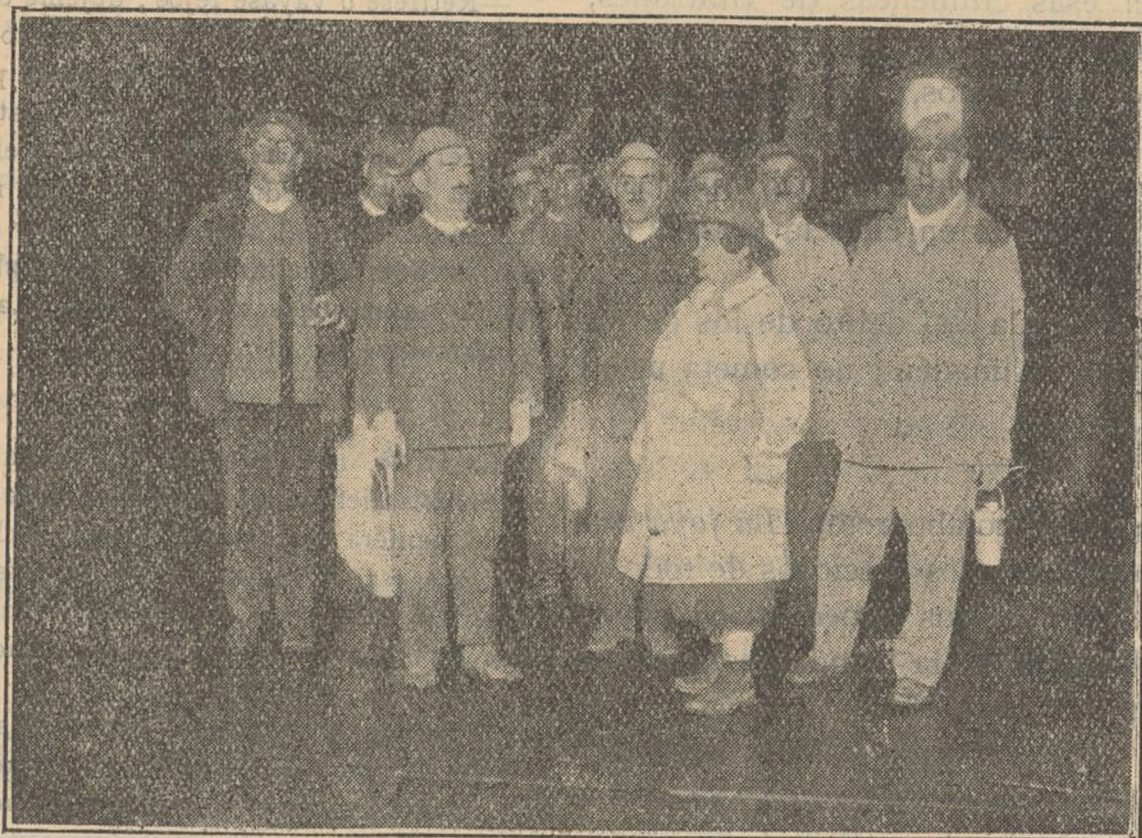
La Redactora-jefe de ASPIRACIONES a 385 metros de profundidad en las Minas de Almadén.

Ahora ya no es el rey; ahora ya no es el general