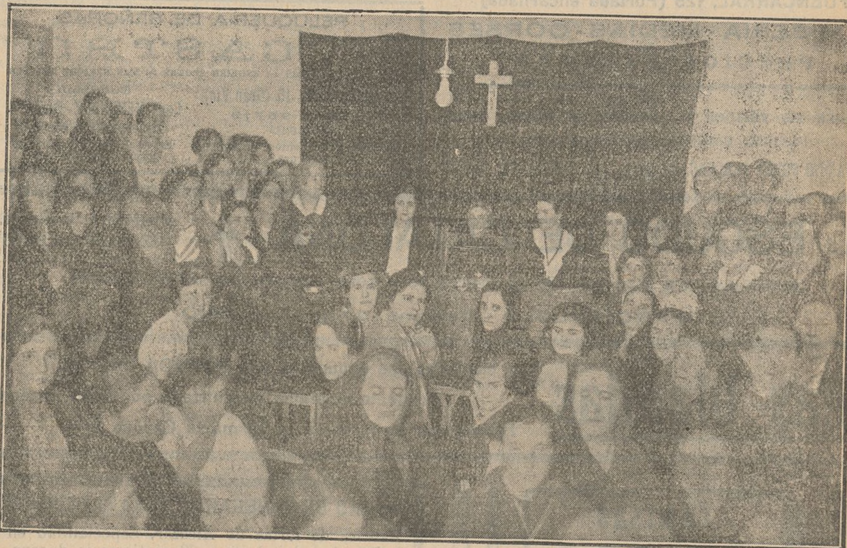
CONFERENCIA EN SORIA DE NUESTRA REDACTORA-JEFE

DEFENDEREMOS, HASTA MORIR SI ES PRECISO, LA RELIGION Y LA PATRIA