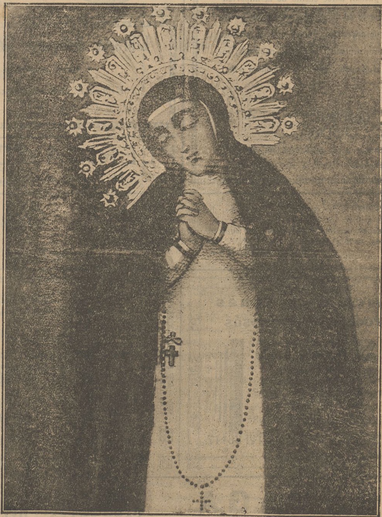
NUESTRA SEÑORA DE LA PALOMA

DEFENDEREMOS, HASTA MORIR SI ES PRECISO, LA RELIGION, LA FAMILIA Y LA PROPIEDAD