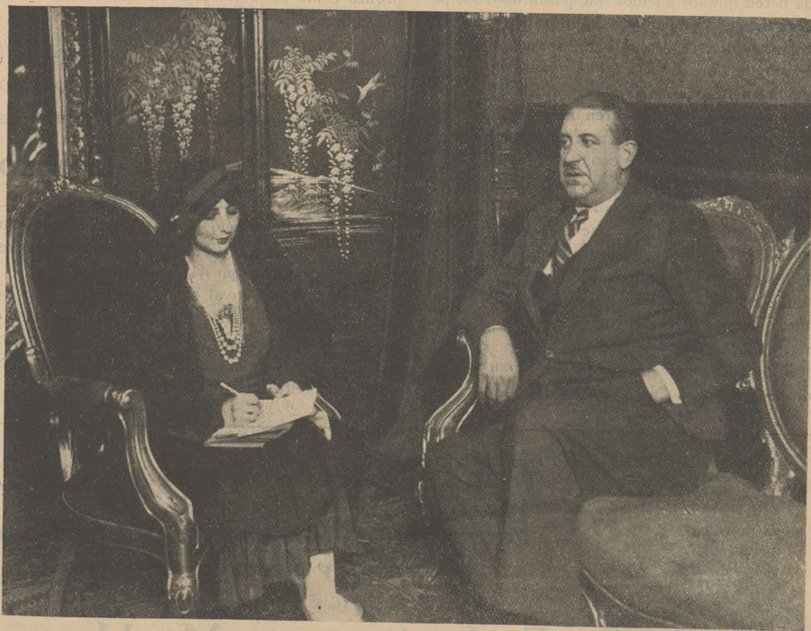
NUESTRA DIRECTORA CON EL "CABALLERO AUDAZ"

Por fin me decidí a la tan deseada entrevista con algo de cobardía, por que no podía olvidar que al