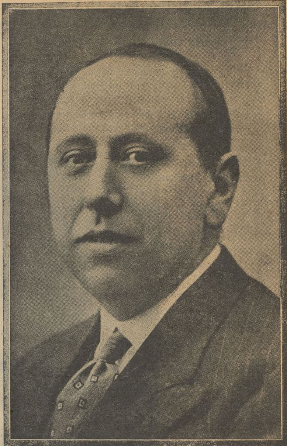
Señor D. José María Gil Robles, que en el pasado domingo reunió más de 40.000 personas en El Escorial.

El Sr. Gil Robles ha estado en su lugar haciendo que se lleve a efecto—pese a quien pese—la parada militar o fascista, como la llaman algunos periódicos de izquierda, en El Escorial. Si cuando la famosa asamblea de los agrarios no se hubieran quedado a las puertas, otra cosa hubiera sido. Perdieron todo, ¡todo!, porque yo no sé que hayan sacado nada. Y allí había hombres, pero se dejaron engañar. Nosotras, que una vez que decimos una cosa procuramos llevarla adelante, vemos con complacencia grande que se haya sostenido el Sr. Gil Robles en esa actitud. Entonces censuramos a los agrarios; de manera que, lo que por fin se ha rea-