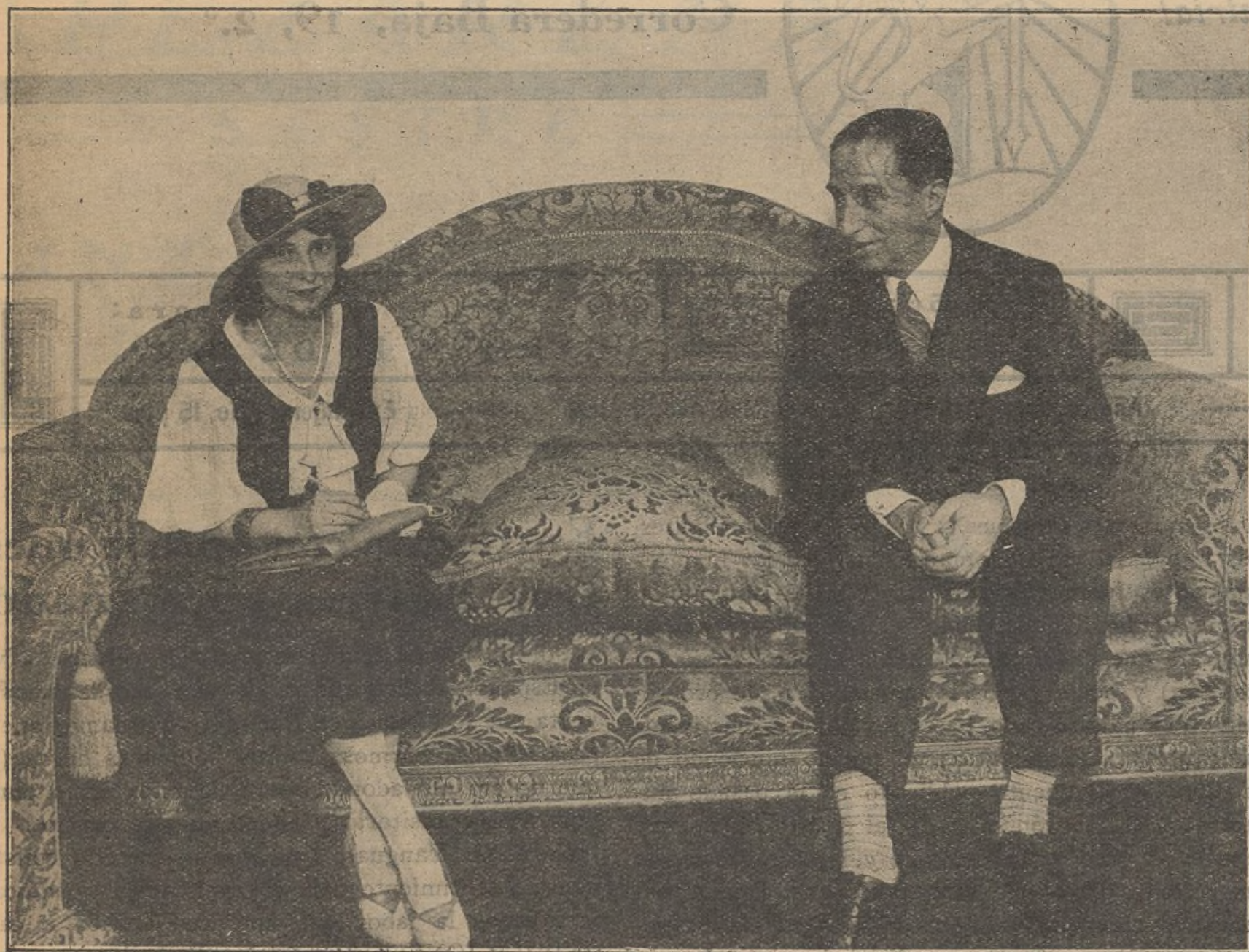
Nuestra Directora hablando con el ex Ministro señor Yanguas Messía, entusiasta siempre de ASPIRACIONES, como puede verse por el reportaje.

Ya se imaginarán ustedes toda la emoción que sentí luego al conocer el resultado de las elecciones,