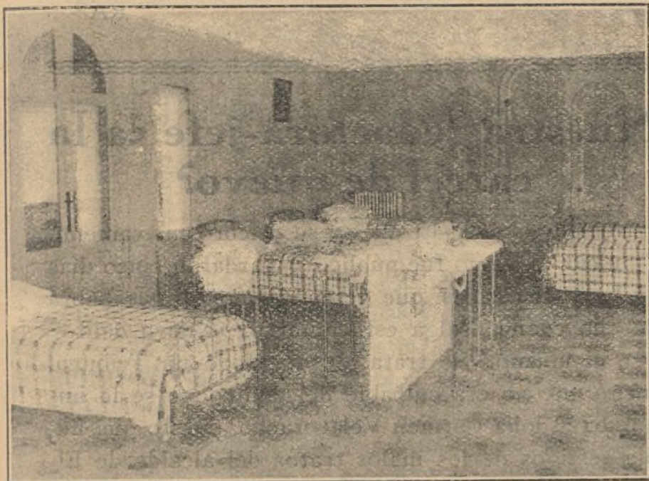
Casa de Nazareth.—Dormitorio que reúne todas las comodidades de higiene y confort modernos. Aquí podrán descansar las pequeñas hijas de periodistas y tipógrafos—de todas las ideas—. ¡No hay distinción en la Casa de Nazareth, como no la hubo para el Niño que nació en Belén!

Era yo niña, ¡cuánto tiempo hace!... Una mañana visité con una amiga un palacio de la calle de Ayala. Fuimos recibidas por una dama vestida de gran luto, pero de belleza admirable y apostura gallarda, y por su hija, muchacha que unía a su gentileza y juventud una belleza de esas que atraen las miradas, pero que al mismo tiempo reflejaba en todo su ser una gran bondad. Llamó mi atención que los faroles de la gran escalera estaban encresponados; las damas asimismo vestían de duelo. El