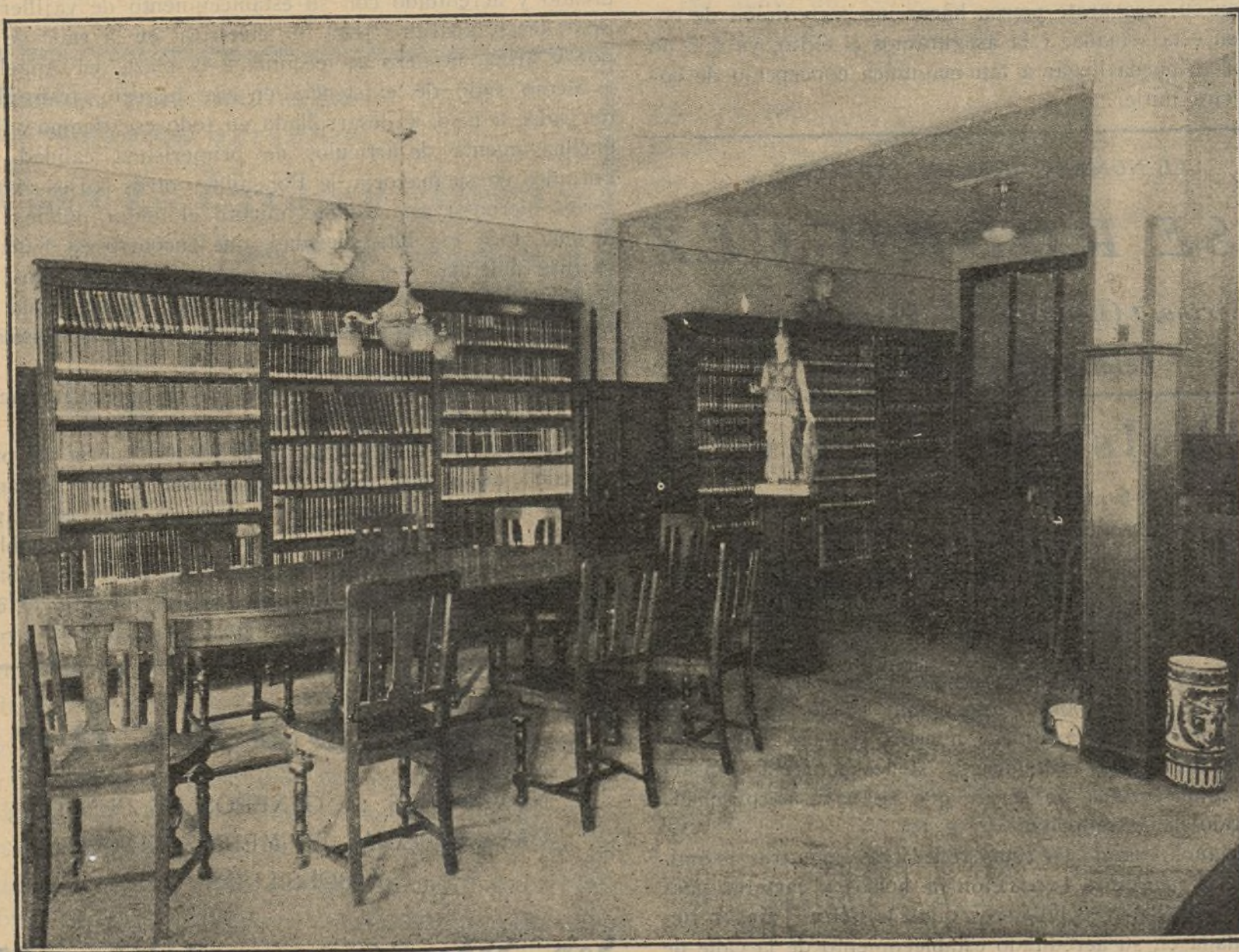
Un encantador rincón de la Biblioteca: parte de la sección infantil y de la de revistas

El puesto de aves y caza de Sucesora de Damián Aldea, instalado en la Plaza del Carmen, Cajón números 1 al 3, teléfono 26146, hace sus suministros a la clientela más selecta y a los más importantes Balnearios.