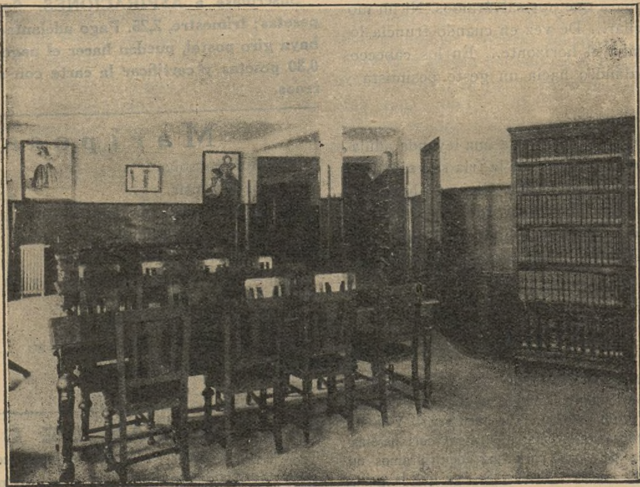
Una sala de la biblioteca