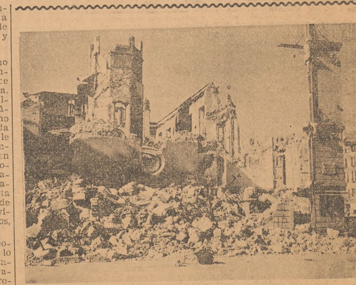
Los destrozos causados por los marxistas a la ciudad de Málaga, pueden

En Madrid, el gobierno se desprecupa del Alcázar (Largo Caballero lo ha dado a entender al general Asensio). No se piensa más que en evacuar la población retirando las tropas a toda prisa para enviarlas rápidamente en dirección de Torrijos