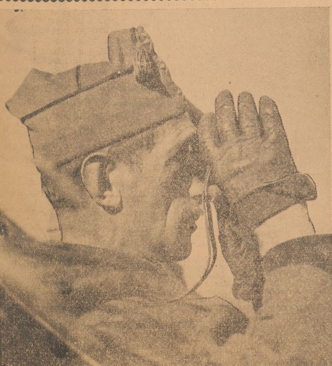
El Coronel Duque de Sevilla, que se ha hecho cargo del mando de la ciudad de Málaga.