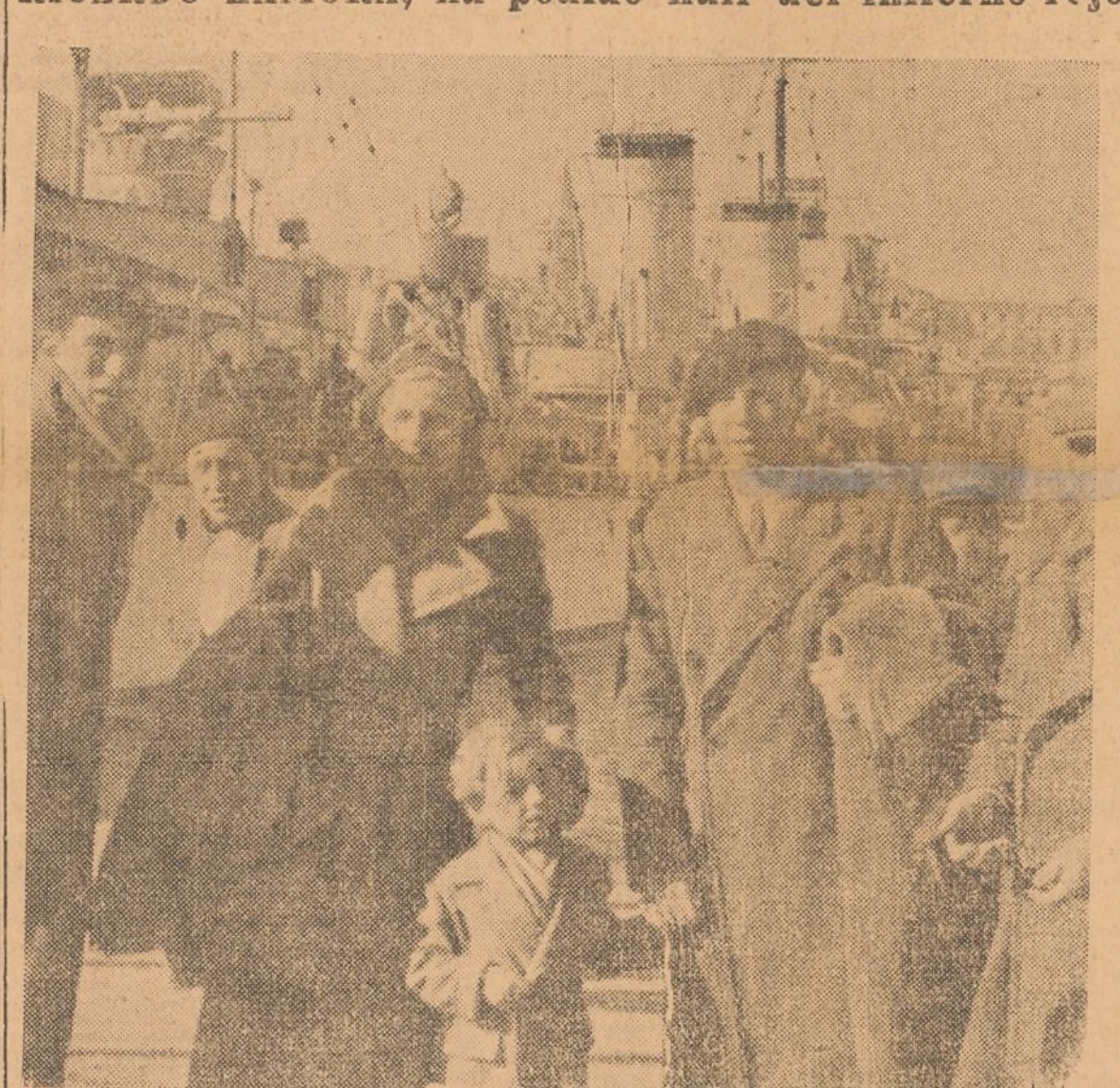
Ricardo Zamora, el famoso futbolista, que había sido « asesinado » repetidamente por la prensa y la radio rojas ha llegado sano y salvo a Marsella. Místele aquí acompañado de su esposa y de su hijo, en el momento de desembarcar en el « Vieux Port » del cañonero argentino « Tucumán ».

RICARDO ZAMORA, ha podido huir del infierno rojo