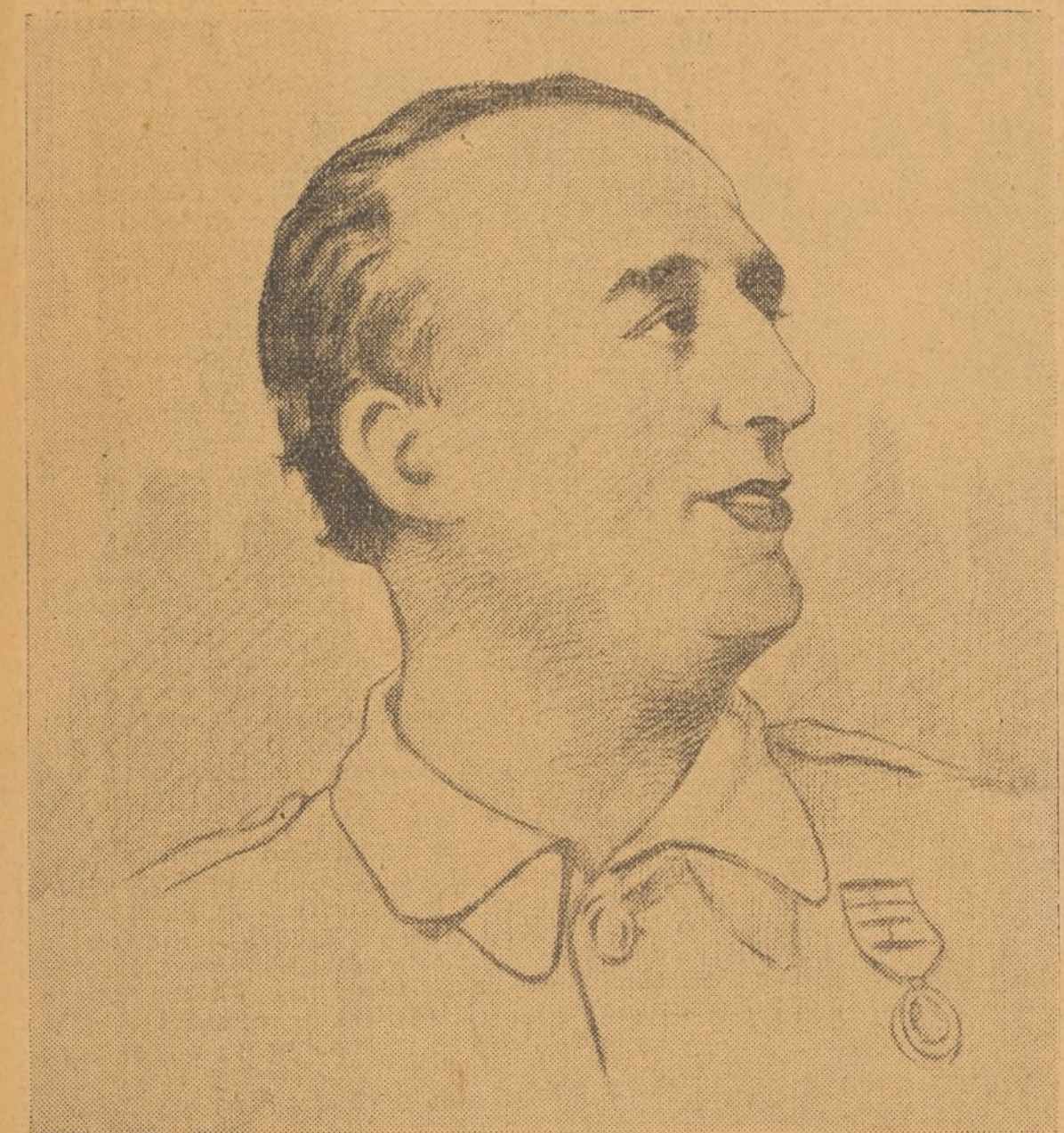
EXCMO. SR. GENERAL DON FRANCISCO FRANCO BAHAMONDE