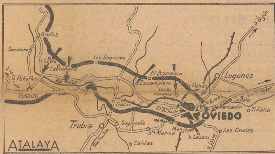
GRÁFICO DE LA SITUACION ACTUAL EN EL FRENTE DE OVIEDO

verdadera España reconocida por el mundo entero que pesaría en el exterior al paso que la otra no tardaría en caer en el caos más espantoso, en liquidarse por sí misma destruyéndose unos a otros los distintos reinos de talas anarcocomunistas en que se resolvía la anti-España.