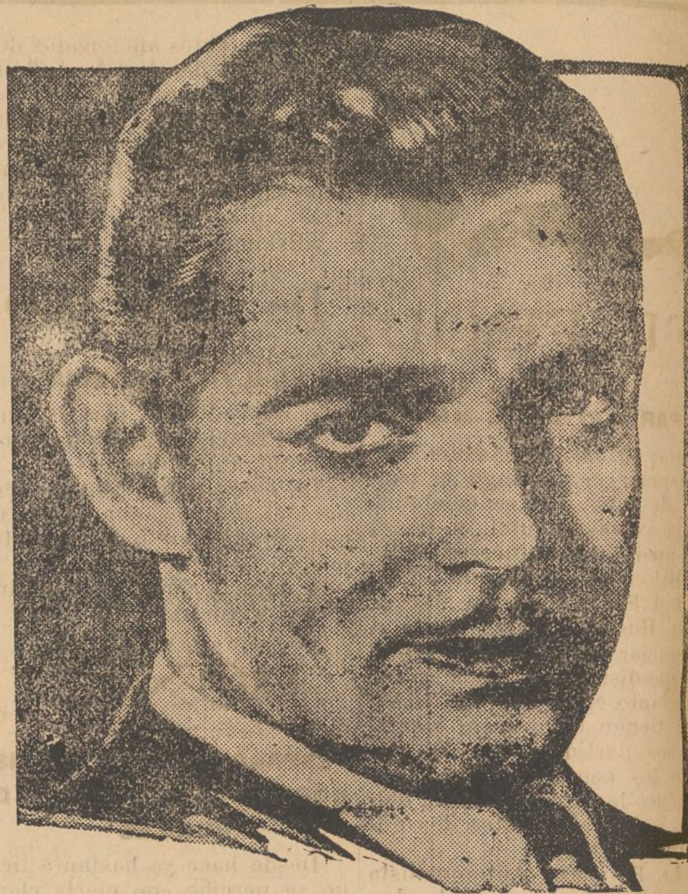
Clark Gable, el famoso galán de la pantalla, que hace una verdadera creación en la producción Columbia «Sucedió una noche», que distribuye la actuaria valenciana CIFESA