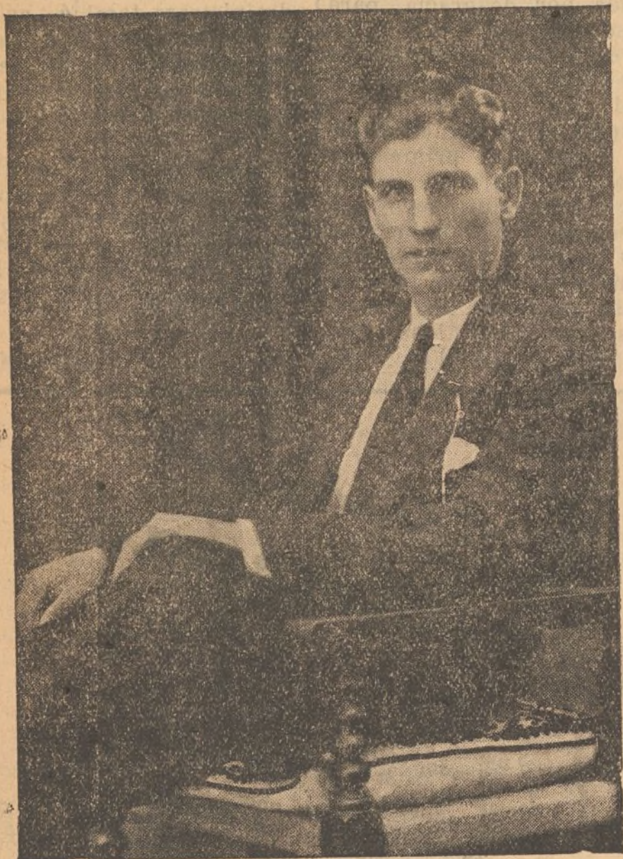
LORENZO GARZA, ganador de la oreja de oro en Méjico

El mejicano Garza torero que tuvo que renunciar a la alternativa, apenas doctorado, porque la «cosa» no le iba tan bien como se esperaba, ya que de novillero no hubo triunfo que no gustara ni éxito que dejara de alcanzar, vuelve a brillar con luz propia y como astro de primera magnitud en el firmamento de la tauromaquia.