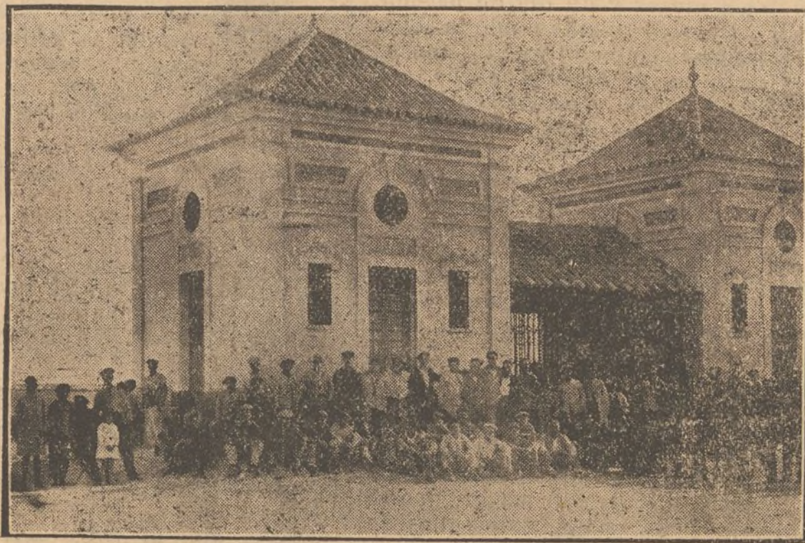
Los obreros parados de Ayamonte formando compactos grupos se estacionan en múltiples sitios; mientras, el hambre se ensaña en sus modestos hogares.

De esos que usted ve ahí —nos dice un anónimo informador que ha reconocido al periodista— son muchos los que salen de madrugada de sus domicilios y no vuelven a ellos hasta las diez o las once de la noche; hora en que calculan que ya descansan sus hijos.