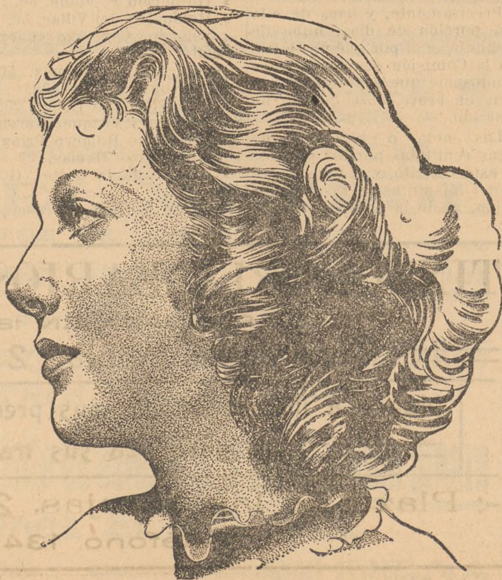
Loreta Young, famosa «star» americana, protagonista de la producción «Fueros humanos», que distribuye GIFESA.

Las películas examinadas por su carácter se distribuyen del siguiente modo: 175 dramas, con 405.000 metros; 109 comedias, con 252.845 metros; 12 operetas, con 29.579 metros; 105 de dibujos animados, con 26.352 metros; 38 películas culturales, con 13.500; cinco películas de argumento diverso, con 11.932; crónicas cinematográficas, con 5.860.